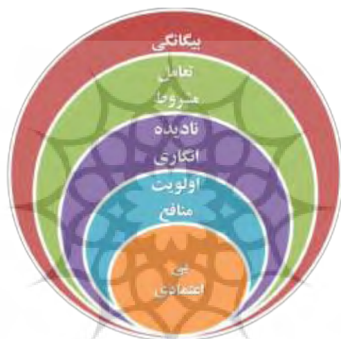
نمودار (۱): درهم تنیدگی میان مقوله مرکزی و مقوله‌های الگوهای پارادایمی

از شکاف میان دو دسته اصلی ذی‌نفعان، تحلیلی ارائه شده است. از رفت و برگشت‌های متمادی میان میدان تحقیق و بررسی و شناسایی مفاهیم و مقوله‌ها در فرآیند گردآوری و تجزیه و تحلیل داده‌ها، چهار مدل پارادایمی با مقوله‌های محوری بی‌اعتمادی، نادیده‌انگاری، اولویت منافع (فردی، سازمانی و ملی) و تعامل مشروط خود را پدیدار ساخته و مقوله هسته‌ای بیگانگی از درون این چهار مقوله برآمده است. در ادامه، شرایط علی مربوط به پدیده مرکزی، شرایط مداخله‌گر و راهبردی کنش/ واکنش بر پدیده اصلی بیگانگی توضیح داده شده‌اند: