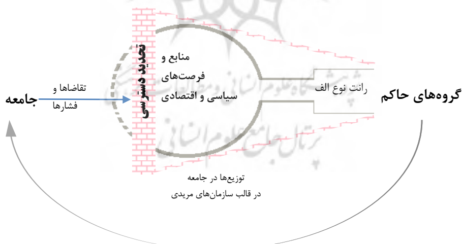
شکل ۱: چارچوب مفهومی نورث: نظم دسترسی محدود

هر سه شرط فوق قابلیت سازگاری با منطق نظام‌دسترسی محدود را دارند و در واقع خود محصول تاریخی آن هستند. «استقرار قوانین و دادگاه‌ها ابزاری است که ائتلاف مسلط به‌وسیله آن روابط میان فرادستان قدرت را تنظیم می‌کند. سازمان‌هایی که حیاتی دائمی دارند محملی برای بستن مجاری ورود و لذا ایجاد رانت به شیوه‌ای نظام‌مندترند. یکپارچه ساختن قدرت نظامی و سایر ظرفیت‌های اعمال خشونت و تحت کنترل نظام سیاسی در آوردن آن‌ها، انحصاری در توسل به زور ایجاد می‌کند که به‌شدت از تکرار خشونت می‌کاهد. ترکیب این شرایط آستانه‌ای سه‌گانه امکان شکل‌گیری روابط غیرشخصی را در درون حلقه تخبگان قدرت فراهم می‌آورد. به خلاف تمایزها میان انواع نظام‌های دسترسی محدود، به نظر می‌رسد تفکیک بین نظام دسترسی محدود و نظام دسترسی باز بر سر جنس باشد و نه درجه. برخلاف الگوی تاریخی که در آن جوامع دسترسی محدود در طول پیوستاری میان نظام‌های شکننده، پایه و بالغ پس‌وپیش می‌روند، گذار از نظام دسترسی محدود به نظام دسترسی باز نسبتاً با سرعت، معمولاً طی پنجاه سال با کمتر، اتفاق می‌افتد» (Ibid: 42). بر اساس آنچه آمد، چارچوب مفهومی رویکرد نورث راجع به نظم‌های دسترسی محدود به شکل زیر است: