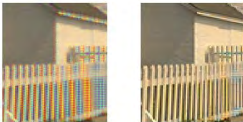
شکل ۵ سمت راست با کنترل فازی و سمت چپ بدون کنترل فازی

شکل‌های ۵ با کنترل فازی و بدون کنترل فازی به دست آمده است.