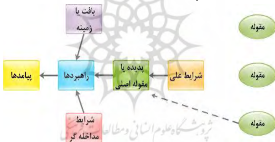
شکل ۲- نمودار کدگذاری باز و الگوی کدگذاری محوری براساس ره‌یافت نظام‌مند استراوس و کوربین

در این پژوهش از طرح نظام‌مند در استراتژی داده بنیاد استفاده شده است. این طرح بر استفاده از کدگذاری سه مرحله‌ای باز، محوری و انتخابی استوار است و در این راستا از پارادایم منطقی یا تصویر نموداری تئوری خلق شده، استفاده می‌کند. براساس طرح نظام‌مند نظریه داده‌بنیاد، برای تحلیل داده‌های کیفی لازم است سه مرحله کدگذاری باز، محوری و انتخابی سپری شود. از بطن داده‌های خام اولیه در مرحله کدگذاری باز ۵۶۰ نکته کلیدی در قالب کد اولیه استخراج شد. سپس این کدها در قالب ۵۹ مقوله فرعی (کدثانویه) و ۱۷ مقوله اصلی دسته‌بندی شدند. نهایتاً طی فرآیند کدگذاری انتخابی، گزاره‌های حکمی یا قضایای پژوهش که بر روابط درونی مقولات اشعار دارند، شکل گرفت.