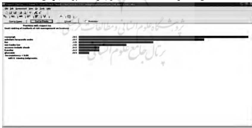
شکل ۲. اولویت‌بندی معیارها در نرم‌افزار اکسپرت چویس

دومین سؤال تحقیق این بوده که ترتیب اولویت‌بندی و اوزان گزینه‌ها (ابزارها) که در درخت تصمیم فرایند تحلیل سلسله‌مراتبی، هدف نهایی نیز است چگونه می‌باشد؟ پس از