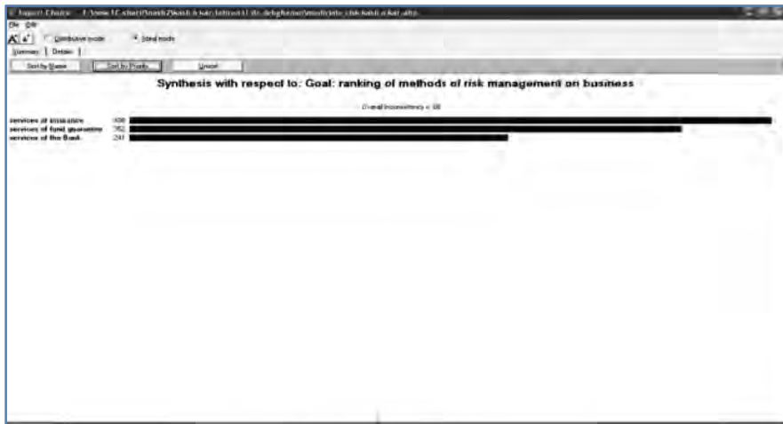
شکل ۳. اولویت بندی گزینه ها در نرم افزار اکسپرت چویس