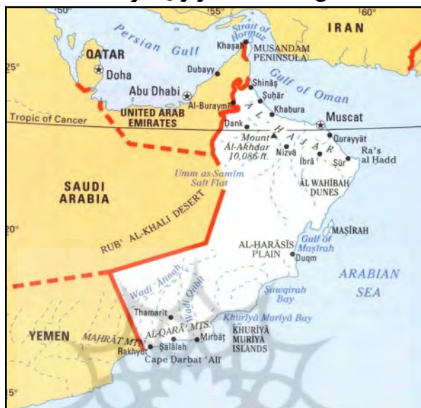
شکل ۲. نقشه تنگه هرمز و کشور عمان

نقش نظام‌های سیاسی نامتجانس حوزه خلیج فارس در بی‌ثبات‌سازی امنیت منطقه _____ ۲۴۵ متعلق به ایران و جزایر کوچک السلامه، المسندام، قوین و النعم متعلق به عمان قرار گرفته است (شاهکار، ۱۳۷۲: ۱۰۵) (شکل ۲).