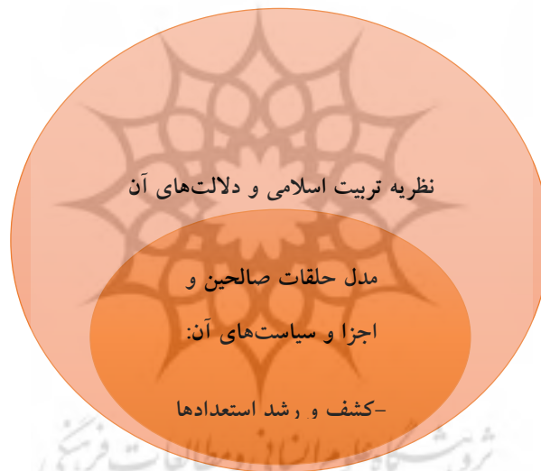
شکل (۱): نسبت نظریه تربیت اسلامی و مدل‌های تربیتی برخاسته از آن

بودن آن شهادت داد و البته بدیهی است که این طرح نیز برای تکمیل و به حقیقت اسلامی شدن، نیاز به تلاش‌های علمی و اجرایی دارد. بنابراین اگر کارکرد اصلی نظریه تربیت اسلامی را رهنمون نمودن انسان به سوی مصداق حقیقی ربّ و پرستش حداکثری او بدانیم، براساس قاعده عقلی-اصولی عموم و خصوص مطلق، نه تنها باید این هدف را در تک تک مدل‌های تربیتی برخاسته از این نظریه تربیتی جست‌وجو کنیم، بلکه باید در تک تک اجزاء و سیاست‌های این مدل‌های برخاسته از نظریه کلی اسلامی تربیت، نیز جست‌وجو کرد. شکل‌واره زیر، به مفهوم آنچه بیان شد، اشاره دارد: