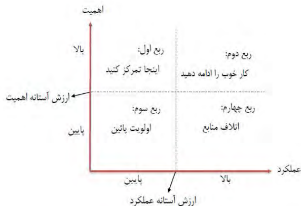
شکل 2: مدل ربعی تحلیل اهمیت - عملکرد (آژر و همکاران، 1395)

ناحیه اول (ناحیه توجه حیاتی): پاسخ‌دهندگان، عوامل را از نظر اهمیت، بسیار بالا ارزیابی می‌کنند؛ ولی سطح عملکرد آنها به نسبت پایین است. بنابراین، باید تلاش‌های بهبود و توسعه را در این ناحیه متمرکز کرد.