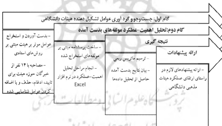
شکل 1: فرایند پژوهش

فرایند این پژوهش پس از مرور مبانی نظری و پیشینه، در قالب نمودار 1 نشان داده شده است. در گام نخست، عوامل تشکیل دهنده هیئتهای مذهبی، با استفاده از روش اسنادی، شناسایی و استخراج شدند. در ادامه به منظور شناسایی دقیق تر عوامل، با 14 نفر از خبرگان حوزه هیئتهای دانشگاهی مصاحبه به عمل آمد و عوامل به دست آمده از روش کتابخانه‌ای تأیید، ادغام و حذف یا اضافه شدند. در گام سوم، با استفاده از روش تحلیل اهمیت - عملکرد، اولویتهای هر یک از عوامل شناسایی شده تعیین شد.