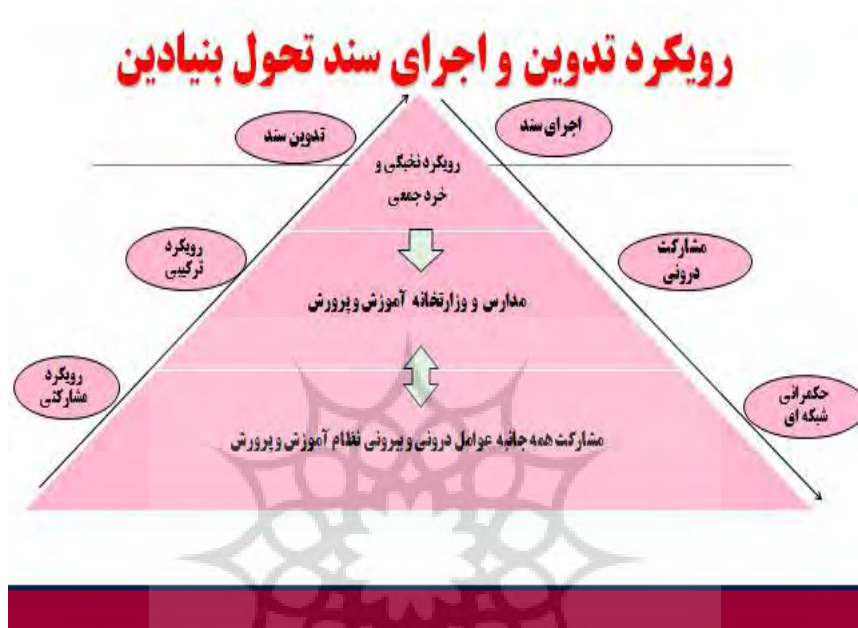
شکل 4: رویکرد تدوین و اجرای سند تحول بنیادین

دانش‌آموزان) در سطح مدرسه به‌علاوه نهاد خانواده، امری ضروری است. این مشارکت نیازمند فرایندهای قانونی، فرهنگی و اجتماعی است. شکل 4، اولین یافته پژوهش رانشان می‌دهد.