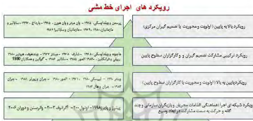
شکل 2: رویکردهای اجرای خط مشی

1993) است که بیش از صد مطالعه دربارهٔ اجرای خط مشی را مرور و تحلیل کرد. گروه آخر که در سالهای اخیر شاهد تلاشهای آنها بوده‌ایم، اجرا را در عصر «پس از بوروکراسی» و «حکمرانی چندسطحی» مطرح کرده‌اند (هال 1 و اوتول، 2000؛ اوتول و مه بر 2 ، 1997). در ادامه به دسته‌بندی مبتنی بر رویکردها که در دسته‌بندی نوع اول نیز جای می‌گیرد، بیش از سایر موارد توجه شده که در شکل 2، قابل مشاهده است. (منوریان، 1394)