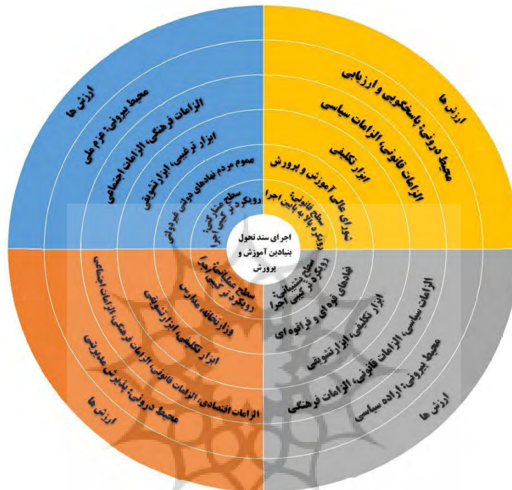
شکل 3: مدل اجرای سند تحول بنیادین آموزش و پرورش

پس از تجزیه و تحلیل داده‌ها و ظاهر شدن مقوله‌های اصلی، مدل اجرای سند تحول ظاهر شده است: