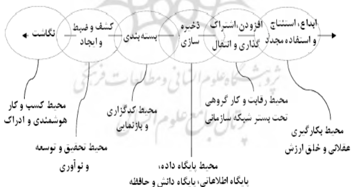
شکل ۲ - مدل زنجیره دانش (Despres and Chauvel, 1999)

دسپرس و چاول در پژوهش خود در رابطه با مدیریت دانش زنجیره‌ای به هم پیوسته از رویدادها و عملیات کاری را مطابق شکل ۲ مطرح کرده‌اند.