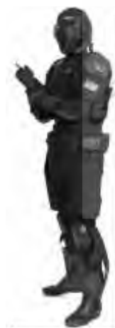
5- N Center

نیروی زمینی آمریکا به دنبال البسه نوینی برای لباس سربازان است، که علاوه بر ضد گلوله بودن، در برابر تهدیدات شیمیایی و بیولوژیکی نیز کارایی داشته باشند. مرکز سرباز نایتیک ۱ وابسته به نیروی