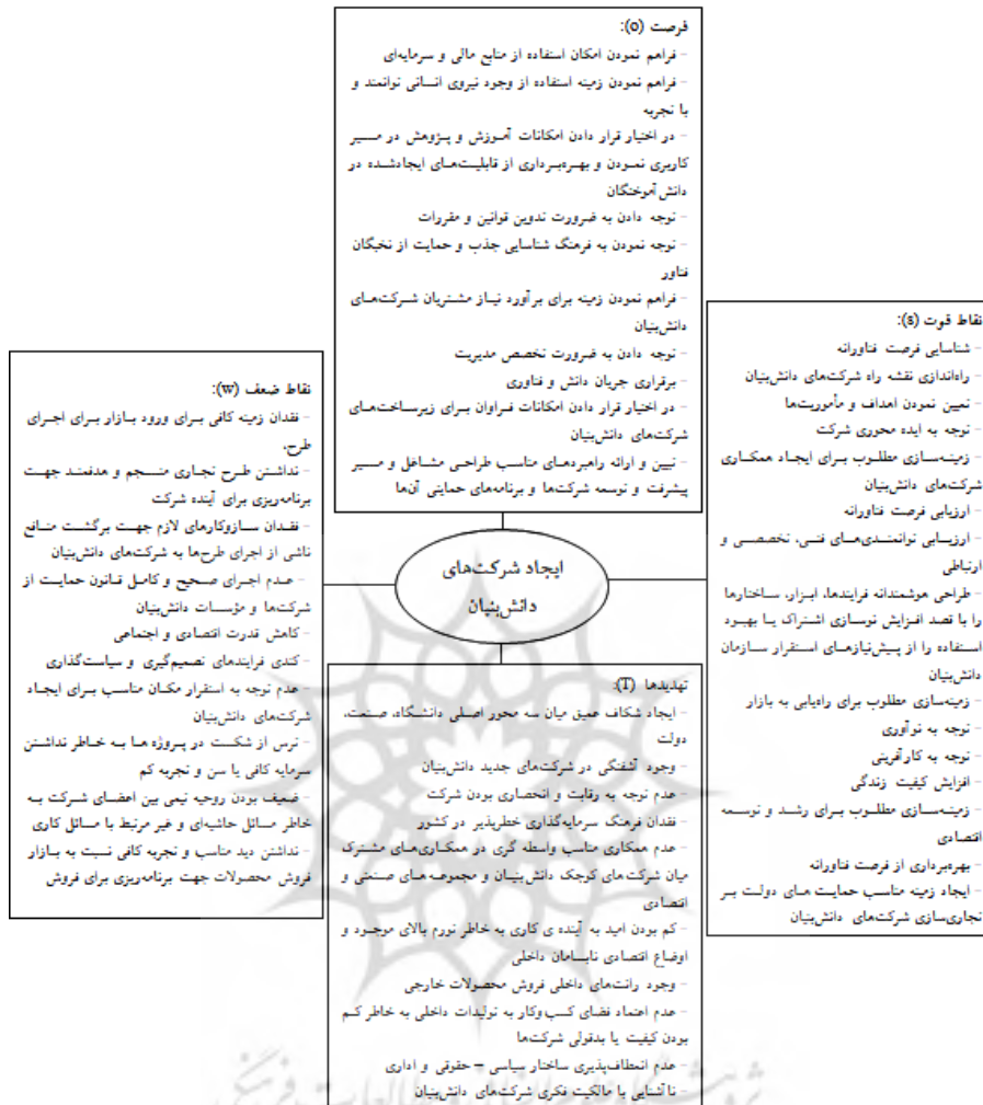
شکل ۱: الگوی کدگذاری عوامل شناسایی شده در ایجاد شرکت‌های دانش‌بنیان با رویکرد swot بر اساس یافته‌های کیفی پژوهش