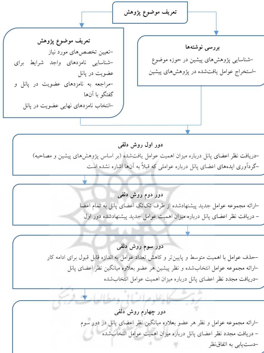
شکل ۲. الگوریتم روش دلفی (مشایخی و همکاران، ۱۳۸۴، ۲۰۶).