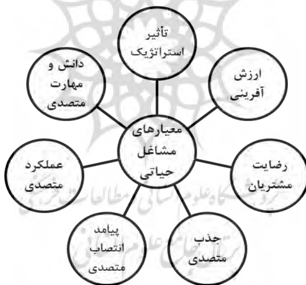
شکل ۱: معیارهای شناسایی مشاغل حیاتی

پرداختند. مصاحبه‌شوندگان در پاسخ به سؤالات مصاحبه مفاهیم گوناگونی را مطرح کردند. پس از شناسایی مفاهیم، این مفاهیم بر اساس نزدیکی و قرابت و وجه اشتراک مفهومی و با توجه به درک پژوهشگران از موضوع مورد بررسی، در قالب تم‌های فرعی دسته‌بندی شدند. در نهایت نیز، تم‌های فرعی شناسایی شده، مورد بررسی چندین باره قرار گرفته و چندین بار پالایش شده و در مواردی تفکیک و ترکیب شدند و بالاخره در قالب تم‌های اصلی دسته‌بندی و مرتب شدند. در طی فرایند شناسایی کدها، ابتدا با بررسی ادبیات موضوع، مفاهیم اولیه و کلی پیرامون مشاغل حیاتی و کلیدی استخراج شد. سپس با انجام مصاحبه‌ها و مطرح شدن مفاهیم جدید و جزئی‌تر، دوباره به ادبیات مراجعه شد تا معادل‌های مناسبی برای این مفاهیم جستجو شود. در نهایت هفت تم اصلی (معیار) برای شناسایی مشاغل حیاتی، سه تم اصلی (معیار) برای شناسایی مشاغل کلیدی شناسایی شدند که به صورت زیر می‌باشند: