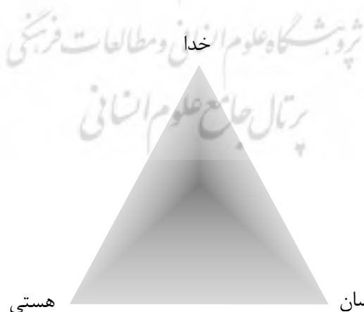
نمودار ۲. مدل الهیاتی - هستی‌شناختی ابن‌عربی

نظامی است که به توضیح هستی‌شناختی معرفت و وجود در نسبت‌های سه‌گانهٔ خلق و خالق و مخلوق می‌پردازد [۲۸، ص ۷۵]. وحدت وجود مورد نظر ابن‌عربی و پیروانش از گونهٔ وحدت وجود شخصی است. وحدت وجود شخصی در برابر وحدت وجود سنخی قرار دارد که بر طبق آن موجودات، اعم از واجب و ممکن، از یک سنخ به شمار می‌روند و کثرت به درجات و افراد وجود بازمی‌گردد [۱۷، ص ۳۱]. وجود به اعتقاد پیروان اندیشهٔ وحدت وجود شخصی، یکی بیش نیست و آن وجود خداوند است. این وجود، مراتب و درجاتی دارد که از حضرت غیب تا عالم حس و شهود را دربرمی‌گیرد. برخلاف فلاسفه که برای تبیین آفرینش مبحث علیت را طرح کردند و نیز برخلاف متکلمان که از خلق و حدوث استفاده کردند، پیروان وحدت وجود برای پدید آمدن هستی، مفهوم تجلی را به کار گرفتند. تجلی در قالب فیض اقدس و مقدس رخ می‌دهد و موجب می‌شود اعیان ثابت‌ه که همان صور و اسمای ممکنات در علم خداوند هستند به گونهٔ اعیان و اشیای خارجی ظهور کنند. جهان مطابق این دیدگاه، جلوه‌گاه و محل ظهور اسما و صفات حق انگاشته می‌شود. اسما و صفات حق از طریق تناکح تکثیر می‌شوند و در جهان ساری جاری می‌شوند. در مقایسه با عرفان پیش از ابن‌عربی، انسان جایگاه مرکزی را به خود اختصاص می‌دهد. انسان حدفاصل تمام عوالم معرفی می‌شود و به خلافت الهی می‌رسد و به تعبیر ابن‌عربی در فص آدم، نگاهبان خزائن الهی، واسطهٔ فیض حق و نیز آینه‌ای می‌شود که حق تعالی از طریق او به جهان می‌نگرد [۲، ص ۵۰]. نمودار ۲ بیانگر مدل الهیاتی - هستی‌شناختی ابن‌عربی است.