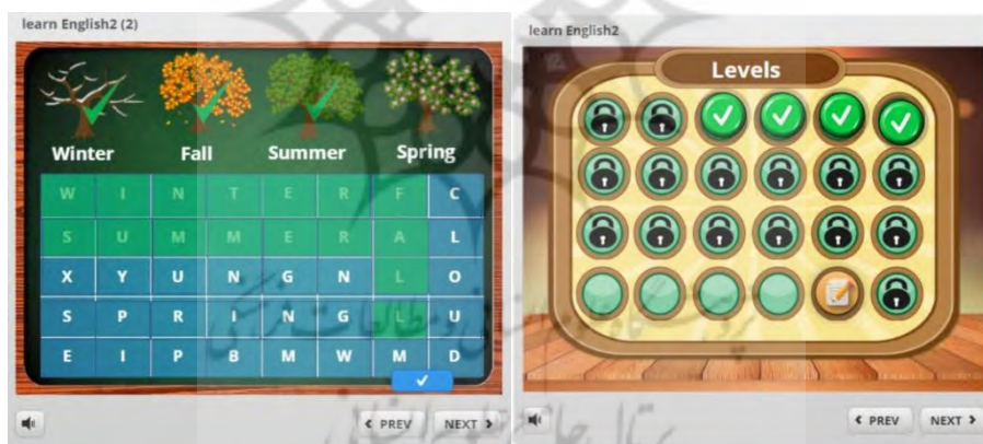
تصویر ۲. محیط بازی دیجیتال

برای گردآوری اطلاعات این پژوهش از آزمون‌های پیشرفت تحصیلی محقق‌ساخته درس زبان انگلیسی پایه هفتم در بخش واژگان، معانی واژگان استفاده شده است که در دو مرحله، قبل از آموزش (پیش‌آزمون) و بعد از آموزش (پس‌آزمون) برگزار شد. روایی این