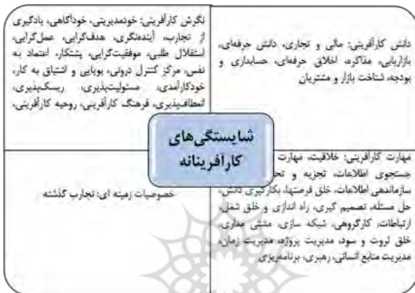
شکل یک - مدل شایستگی‌های کارآفرینانه

کارآفرینی، تمایل به کسب سود بالا، تمایل به یادگیری مادام‌العمر، بودن در شرایط مبهم و نامطمئن، آغازگر تغییر و مدیریت آن و مهارت در تدوین طرح شغلی، ۴۷ شایستگی به شکل مدل شایستگی‌های کارآفرینانه درآمد که در شکل یک مشاهده می‌شود: