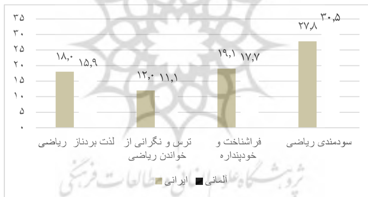
نمودار ۲: میانگین ابعاد نگرش دانش‌آموزان به تفکیک گروه

بررسی تفاوت نگرش دانش‌آموزان ایرانی و آلمانی: به‌منظور بررسی تفاوت نگرش دانش‌آموزان ایرانی و آلمانی در متغیرهای احساس ترس و نگرانی از خواندن ریاضی، سودمندی و مفید بودن ریاضی، فراشناخت و خودپنداره فرد نسبت به ریاضی و لذت بردن از ریاضی از آزمون تی مستقل استفاده شد که نتایج آن در جدول (۳) آمده است.