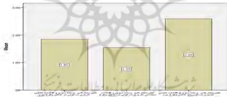
شکل (۳): رتبه بندی و اولویت بندی معیارهای کاربری مسکونی در کاهش وقوع جرم در کلانشهر تبریز