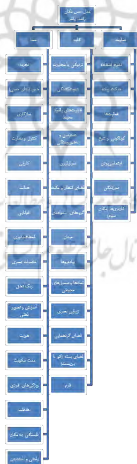
شکل ۱. مدل مفهومی طبقه‌بندی مؤلفه‌های تعاملات اجتماعی بر اساس مدل حس مکان رلف-پانتر