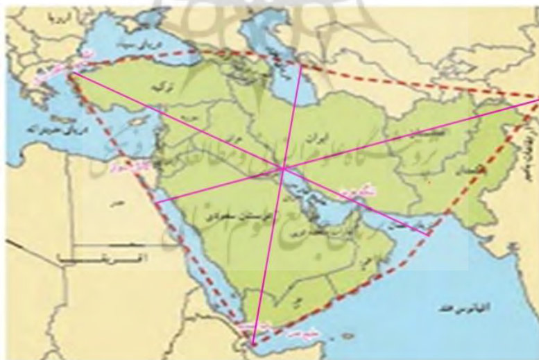
شکل ۲. ایکیومنی رأس خلیج فارس، مرکز مثلث آسیای جنوب غربی

مشکل اصلی منطقه آسیای جنوب غربی جدایی ایکیومنی‌های ملی و متراکم‌ترین حوزه‌های تمرکز جمعیتی و فعالیت اقتصادی از یکدیگر به دلیل وجود کوه‌ها، فلات‌ها و بیابان‌هاست. در این میان سه استثنا در رأس خلیج فارس، خلیج اسکندرون و حفاصل عربستان و بحرین وجود دارد که به ایکیومنی‌های فراسوی مرزهای ملی مربوط می‌شود (کوهن، ۱۳۸۷، ۶۸۵). بزرگ‌ترین ناحیه یکپارچه فراملی آسیای جنوب غربی در رأس خلیج فارس قرار دارد که در امتداد ساحل از بندر کویت تا بصره-دومین شهر بزرگ عراق در ساحل اروندرود- [به طول ۱۳۰ کیلومتر] و از بصره تا خرمشهر [به طول ۵۰ کیلومتر] در مصب رودهای کارون و اروندرود کشیده شده است. ۱ اقتصادهای این نواحی هم‌جوار بر پایه حوزه‌های نفتی کویت، جنوب عراق و جنوب غربی ایران است، اما خطوط لوله، بندرها، پالایشگاه‌ها، صنایع پتروشیمی و شهرهایشان هیچ ارتباطی با یکدیگر ندارند (کوهن، ۱۳۸۷: ۶۸۶). در این میان، نقشه پنج‌ضلعی منطقه را می‌توان به صورت مثلث فرض کرد و با ترسیم میانه‌های مثلث که در رأس خلیج فارس یکدیگر را قطع می‌کنند به اهمیت این ناحیه به‌عنوان مرکز مهم‌ترین منطقه نظام ژئوپلیتیک جهانی پی برد.