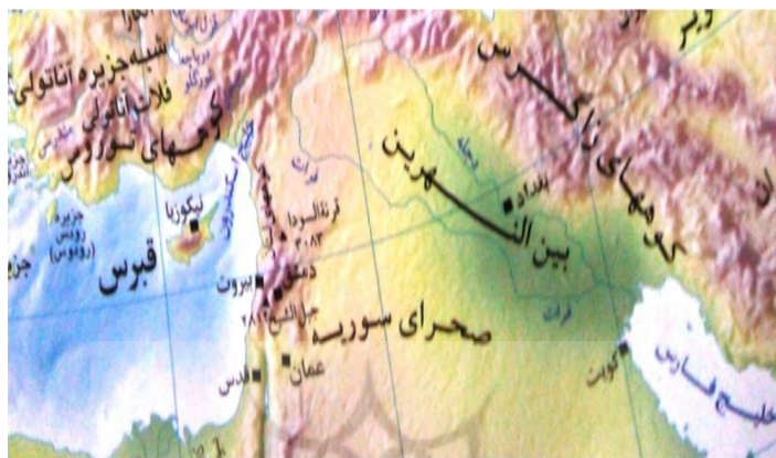
شکل ۳. نمایی مشترک از موقعیت منطقه‌ای ایکيومنی‌های رأس خلیج فارس و خلیج اسکندرون

مجموعه یکپارچه فراملی دیگر، خلیج اسکندرون است که در محل تلاقی رودخانه نهرالعاصی به دریا، دو کشور سوریه و ترکیه را با یکدیگر پیوند می‌دهد. لاذقیه مهم‌ترین بندر سوریه و حلب دومین شهر بزرگ و مهم‌ترین شهر تولیدی این کشور، در مجاورت استان ختای ترکیه قرار دارند. انطاکیه (مرکز استان ختای) و اسکندرون مراکز شهری مهم ختای هستند. از این منطقه تمرکز جمعیتی به سمت غرب و در امتداد مرکز تولیدی ترکیه یعنی آدانا پیش می‌رود. این منطقه که در شرایط سیاسی متفاوت ممکن بود به یک ایکيومنی متحد تبدیل شود، شبکه‌ای از بندرها، بزرگراه‌ها و راه‌آهن دارد که به ترکیه، سوریه و عراق منشعب شده‌اند (کوهن، ۱۳۸۷: ۶۸۶).