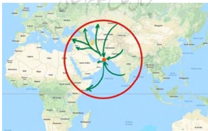
شکل ۴. چابهار، کانون اتصال سه قاره آسیا، اروپا و آفریقا

کوهن از ایکيومنی دیگری در خلیج فارس یاد می‌کند که عربستان را به بحرین متصل می‌کند و بخش‌هایی از دو منطقه میانی و بیابان جنوبی را دربرمی‌گیرد. این ناحیه از ریاض در بیابان داخلی تا ساحل مراکز سعودی الدمام و الجبیل را پوشش داده است و از آنجا به مجمع‌الجزایر بحرین می‌رسد (همان: ۶۸۶ - ۶۸۷)، اما با فعال شدن دو ناحیه پیش‌گفته، آینده ناحیه ریاض منامه در گرو نحوه تعامل با این دو ناحیه است. ناحیه یکپارچه دیگری که از جاسک و چابهار ایران تا گوادر پاکستان امتداد دارد، یک ذخیره راهبردی و چهارراهی است که می‌تواند در کنار دو ایکيومنی منطقه‌ای دیگر به کانون ارتباط دریایی، زمینی و هوایی جنوب و جنوب غربی آسیا با سایر حوزه‌های ژئوپلی‌نومیک و پیوندگاه اقتصاد سیاسی منطقه با اقتصاد سیاسی جهانی تبدیل شود. سکوت کوهن درباره این ناحیه قابل تأمل به نظر می‌رسد.