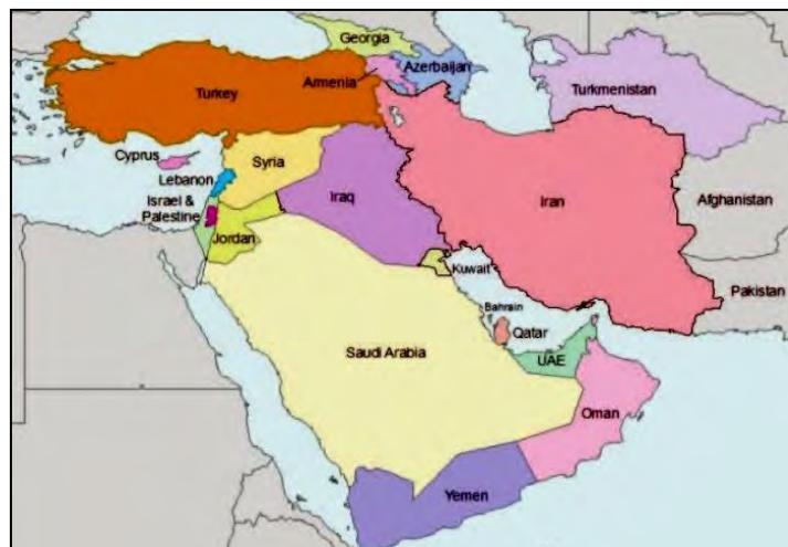
شکل ۱. آسیای جنوب غربی، پیوندگاه سه قاره