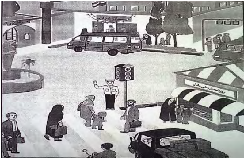
شکل ۱: نگارش درباره تصویر