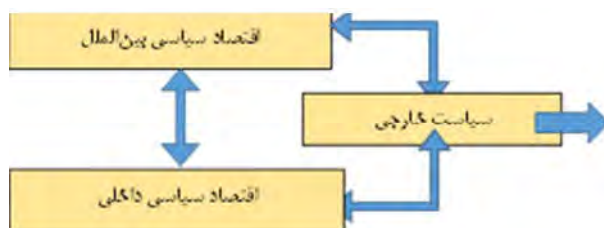
شکل ۲. رابطه اقتصاد سیاسی بین‌الملل با اقتصاد سیاسی داخلی

از این منظر شکل‌گیری الگوهای مختلف سیاست خارجی در هر کشوری را در یک سطح یعنی سطح داخلی را باید تابعی از نیازهای عمومی و ضرورت‌های ساختاری آن دانست که در فرآیند تحولات چندلایه و چندگانه سیاسی، اجتماعی و اقتصادی شکل می‌گیرد؛ به عبارت دیگر، «وضعیت سیاست خارجی یک کشور تابع ماهیت قدرت و ساختار و لایه‌های اجتماعی فکر و ثروت است». از این رو، مقدمه «شناخت سیاست خارجی هر کشوری شناخت جامعه آن کشور است و ادراک جامعه‌شناسی سیاسی مقدمه ادراک سیاست خارجی می‌باشد» (سریع‌القلم، ۱۳۸۸: ۲۵). به معنایی دیگر، «سیاست خارجی دولت به پیچیدگی روابط دولت و جامعه مربوط می‌شود که با هم در ارتباط متقابل هستند؛ بنابراین، سیاست خارجی تحت تأثیر ساختار اقتصادی-اجتماعی قرار دارد (کولایی و شکوه، ۱۳۹۰: ۲۹۰). بدین ترتیب، یک منبع اساسی سیاست خارجی ساختار داخلی است که ماهیت نهادهای سیاسی و دولتی، ویژگی‌های جامعه و ترتیبات نهادی که جامعه و دولت را به هم مرتبط می‌کند را در بر می‌گیرد (آران و آلدن، ۱۳۹۳: ۷۰).