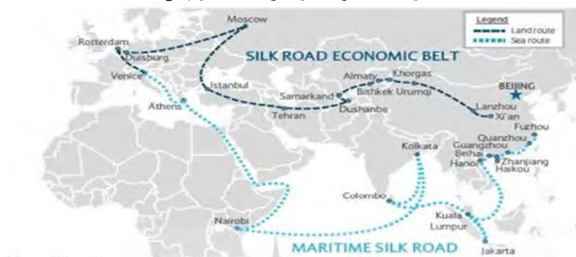
نقشه شماره ۲: (مسیر ابتکار کمربند جاده از چین تا هلند)

https://www.ghy.com/images/uploads/default/Silk_Road_Map.jpg