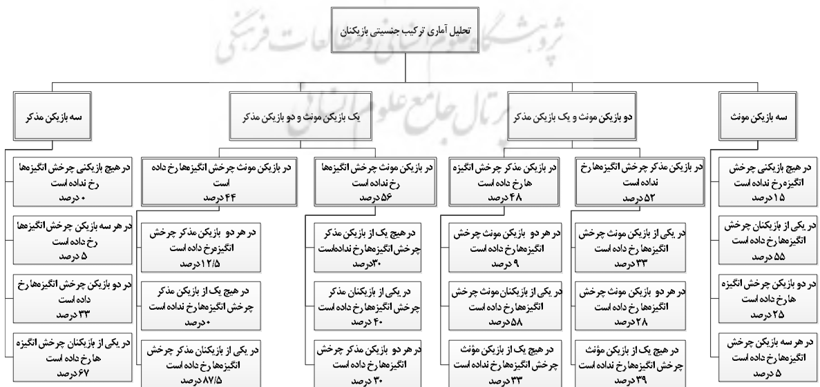
نمودار ۲. تحلیل آماری ترکیب جنسیتی بازیکنان در بازی دوم