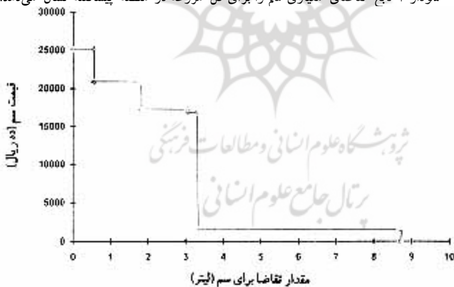
نمودار ۳. منحنی تابع تقاضای معیاری سم برای کل مزرعه

نمودار ۳ تابع تقاضای معیاری سم را برای کل مزرعه در منطقه پیشگفته نشان می دهد.