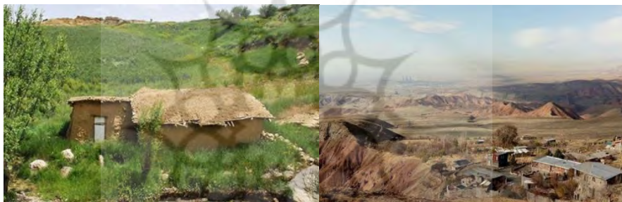
عکس ۴: روستای شاه کوه

دو امامزاده هم در این روستا قرار دارد به نام‌های امامزاده یوسف و حسین که از نوادگان امام موسی بن جعفر می‌باشند. این آرامگاه بسیار ساده، اتاقی کوچک بوده و با خشت و گل و سقفی چوبی ساخته شده است. ( www.parsine.com )