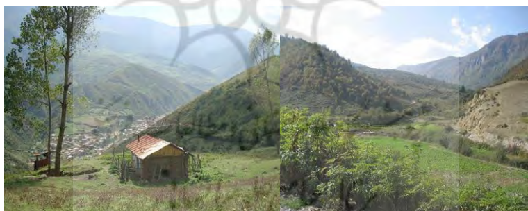
عکس ۲: روستای زیارت

در اطراف جاده منتهی به امامزاده مغازه هایی هستند که به نوعی مرکز خرید روستا برای مسافران را شکل می دهند. صنایع دستی ساکنان محلی، میوه های جنگلی و محصولات دامی محلی از جمله محصولات هستند که می توان در این مغازه ها یافت. کافه ها و رستوران ها و سفره خانه نیز در نزدیکی روستا قرار دارند و هتلی هم برای اقامت مسافران ساخته شده است (www.karnaval.ir).