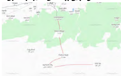
نقشه ۳: روستاهای مسیر گردشگری