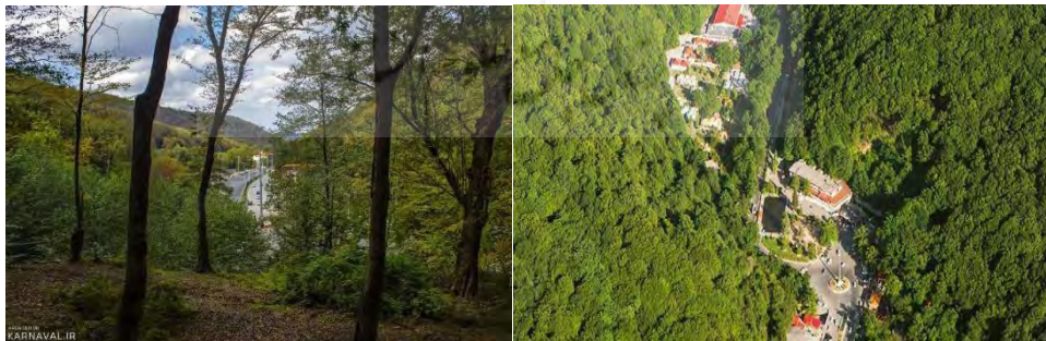
عکس ۱: ناهارخوران گرگان