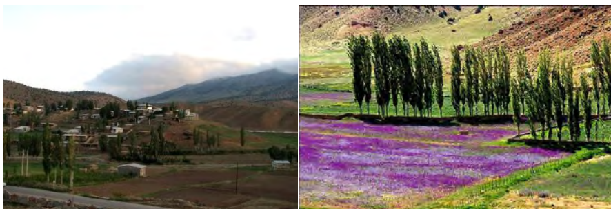
عکس ۳: روستای چهارباغ

-کوه جنگلی تل انبار: اگر از شهر گرگان به سمت جنوب روبرگردانیم، رشته کوهی را می‌بینیم که شهر را همچون کمانی در بر گرفته است. کوه جنگلی تل انبار در فاصله ۲۳ کیلومتری جنوب گرگان و در ۶ کیلومتری شمال غربی روستای چهارباغ قرار گرفته است. بلندترین قله این رشته کوه تل انبار نام دارد. به ارتفاع ۳۰۸۰ متر، این رشته کوه یکی از منابع اصلی تأمین آب شهر گرگان است که مشکل از دره‌های متعددی است که انتهای این دره به آبشار دوقلو زیارت ختم می‌شود و سرچشمه رودهای چهارباغ، سوت‌رود و خاصه‌رود می‌باشد.