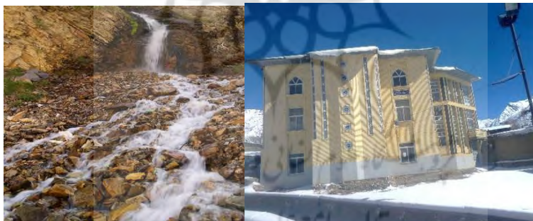
عکس ۵: روستای تاش

۴-معدن مواد پودر شوینده(www.tash92.blogfa.com)