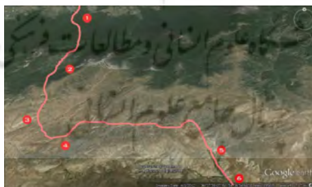
نقشه ۲: عکس هوایی روستاهای مسیر گردشگری

قره سو، اترک و گرگانرود از رودهای پرآب استان محسوب می‌شوند و پیرگردکوه بلندترین کوه استان بوده و کوه‌های گلدین، اشهکوه، زریوان و خواجه قنبر از دیگر کوه‌های مهم استان بشمار می‌روند. این استان طبق شواهد موجود از بیشترین جاذبه‌های توریستی در بخش‌های طبیعی، جنگلی و اکوتوریستی برخوردار بوده و از این لحاظ می‌تواند قطب اکوتوریسم شمال باشد. یکی از زیباترین جلوه‌های اکوتوریستی استان گلستان، همچون سایر نواحی شمالی ایران، وجود روستاهای زیبا به ویژه در دل جنگل‌های بکر و شگرف آن است که بر مبنای حفاظت از محیط‌زیست و جذب حداکثر گردشگر، روستاهای موجود در مسیر کوهنوردی از نهارخوران گرگان به سمت جنوب شناسایی شدند. این منطقه به طول ۴۵ کیلومتر از روستای زیارت در جنوب گرگان شروع و پس از عبور از روستاهای چهارباغ، شاه کوه و تاش علیا به تاش سفلی ختم می‌شود. زیارت، چهارباغ و شاه کوه در استان گلستان و تاش علیا و تاش سفلی در استان سمنان واقع شده اند که در زیر به بررسی برخی از ویژگی‌های آن‌ها پرداخته می‌شود: