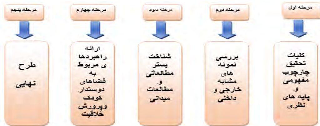
شکل ۲- روش گردآوری اطلاعات

چارچوب نظری این تحقیق بر مبنای نظریه شهر دوستدار کودک می‌باشد و روش های کیفی پرسشنامه، مصاحبه (انفرادی و گروه‌های کوچک ۲)، تحلیل های گرافیکی (عکس، نقشه، نقاشی کودکان) برای کسب اطلاعات دقیق از محدوده مورد استفاده قرار خواهد گرفت. جامعه آماری شامل کودکان پی ش دبستانی (۵-۷ سال) و سنین دبستان (۷-۱۱ سال) و والدین کودکان در محله فرهنگ مشهد می باشد. تعداد ۵۰ کودک ۲۰ بزرگسال بصورت تصادفی از محله مورد پژوهش قرار می گیرند. مراحل انجام این پژوهش به شرح زیر تعریف و تبیین می‌گردد: