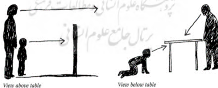
شکل ۱- ادراک کودک از محیط

کودکی وپرداختن به آن به طور خاص قدمت زیادی ندارد. طبق آنچه که مارک دودک در معماری مهدکودک می گوید؛ ایده نگاه به کودکی از غرب ودر اواخر قرن ۱۷ میلادی صورت گرفته است(Day,2007). جان لاک معتقد است که تجربه های نخستین آدمی عمیقا بر زندگی بعدی او اثر می گذارند و بر همین اساس بر نقش تربیت و اهمیت پرورش تاکید می کند. پیاژه در سال های دهه ۱۹۲۰ به این نتیجه رسید که کودکان در مقایسه با بزرگسالان، جهان را به طور دیگری می بینند. کودکان محیط پیرامون خود را تغییر می دهند تا وضعیت خودشان را بهبود بخشند(Day,2007). برخلاف بزرگسالان که محیط را از طریق فرم درک می کنند، جنبه هایی از محیط برای کودکان مهم است که بتوانند محیط را بر اساس کاربری های مختلفی که به آن می دهند، تغییر دهند. بچه ها به ویژگی های جزیی وتصادفی محیط توجه می کنند. مطالعات پوکک وهادسون (۱۹۷۸) حاکی از توجه بیشتر کودکان به جزییات کف، ویژگی های بدنه جاده وفضاهای بازی کودک دارد(لنگ،۱۳۸۱). منبع الهام کودک محیطی است که در آن احاطه شده ومنبع الهام بزرگسالان، خود اوست.