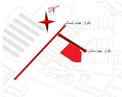
شکل ۳- آنالیز سایت (نگارندگان)