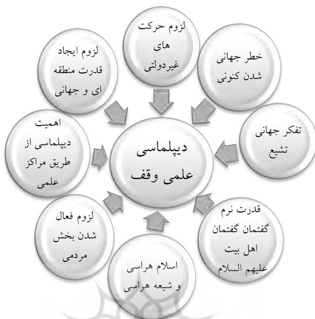
شکل شماره (۵). ضرورت دیپلماسی علمی وقف