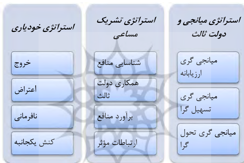
شکل شماره ی ۱؛ استراتژی های سه گانه ی مدیریت منازعات

مکانیسم خود-یاری که به مثابه سیاست «یک جانبه گرایی» شناخته می شود، شامل فعالیت های سیاسی، اقتصادی و نظامی می باشد که بدون همکاری و مشاورت دولت های دیگر اجرایی می شود. زمانی که تهدید محدود و متمرکز بر دولت خاص باشد، مکانیسم خودیاری به کار گرفته می شود. همچنین این رویکرد به عنوان مکانیسم تلافی تلقی می شود. این مکانیسم به دولت این امکان را می دهد تا از سنجه های فراقانونی برای واکنش به اقدام غیر قانونی بازیگر مهاجم استفاده نماید. مکانیسم دفاع جمعی که اغلب به عنوان رویکرد «اتحاد» شناخته می شود اغلب زمانی به کار برده می شود که دولت ها برای تأمین امنیت متقابل خودشان علیه دشمن مشترک به یک توافق و ائتلاف رسمی دست می زنند. محدودیت این رویکرد در عدم اشتغال دولت های بیرون از ائتلاف و اتحاد می باشد. مکانیسم سوم برای مدیریت و مقابله با تهدید، رویکرد امنیت جمعی می باشد؛ این رویکرد به مثابه یک سامانه ی نهادی در سطح منطقه ای یا جهانی می باشد که تهدیدات را به عنوان هزینه ای برای دولت ها شناسایی می نماید و یک کنش جمعی برای