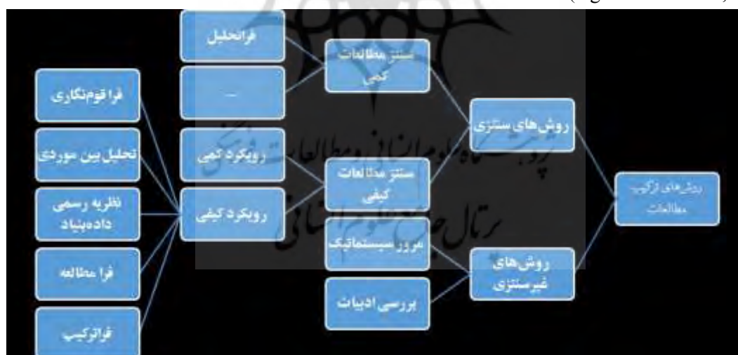
نمودار ۱: جایگاه روش فراترکیب در روش‌های ترکیب مطالعات

«فراقوم‌نگاری می‌کوشد روابط بین و درون مطالعات فردی را از طریق استعاره‌ها بیان کند» (Noblit & Hare, 1988). «نظریه رسمی داده‌بنیاد که گسترش نظریه داده‌بنیاد است یک روش تطبیقی ثابت را برای جمع‌آوری داده‌ها، تحلیل و توسعه نظریه استفاده می‌کند» (Corbin & Strauss, 2008). «با این حال، این روش‌شناسی‌ها، روش یا راهبرد نمونه‌گیری را در مورد ارزیابی مطالعات فردی نشان نمی‌دهد» (Aguirre & Bolton, 2014, p. 282). فرامطالعه یک روش نظام‌مند چند مرحله‌ای است که فرا تئوری، فراروش و فراتحلیل را شامل می‌شود. در نمودار زیر جایگاه روش فراترکیب بین سایر روش‌های مشابه در ترکیب مطالعات نشان داده شده است.