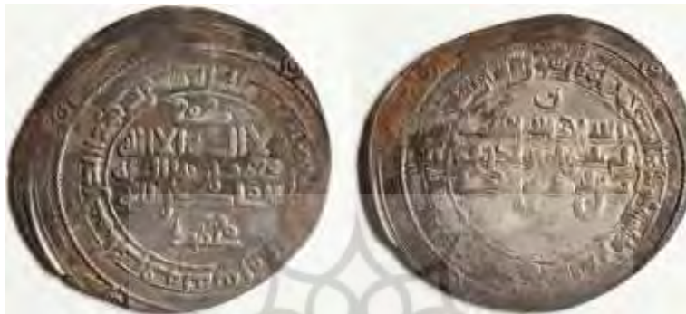
(موزه ملی ملک، شماره سکه ۳۹۴، شماره اموال ۱۴۳).

اطراف خود دارد. طرح روی سکه در پشت سکه نیز تکرار شده است. در مرکز، دایره‌ای قرار دارد که نوشته‌های آن به خط کوفی ساده عبارت‌اند از: «الله احد الله الصمد لم یلد و لم یولد ولم یکن له کفوا احد». در حاشیه علاوه بر «محمد رسول الله»، آیه ۳۳ سوره بقره نقر شده است: «ارسله بالهدی و دین الحق لیظهره علی الدین کله ولو کره المشرکون».