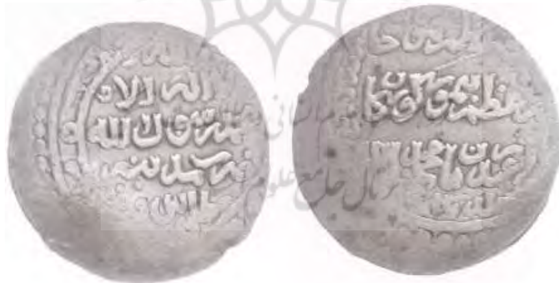
(علاءالدینی، سکه‌های ایران دوره گورکانیان، ۲۴)

سکه شماره ۲: این سکه ۶/۱۴ گرم وزن و ۲۸/۴ میلی متر قطر دارد. نوشته‌های پشت سکه به خط کوفی تزئینی درون یک دایره قرار دارند: «لا اله الا الله محمد رسول الله ضرب مدينة طواس». حاشیه سکه به دلیل آسیب دیدگی قابل خواندن نیست. در روی سکه نیز نوشته‌ها درون یک دایره قرار گرفته‌اند و به ترتیب از بالا به پایین عبارت‌اند از: «سلطان اعظم محمودخان امیر اعظم تیمورگورکان ولی عهد زمان محمد سلطان خلد ملکهم». حاشیه روی سکه آسیب دیدگی دارد و فقط عبارت «سنة اربع» را می‌توان خواند.