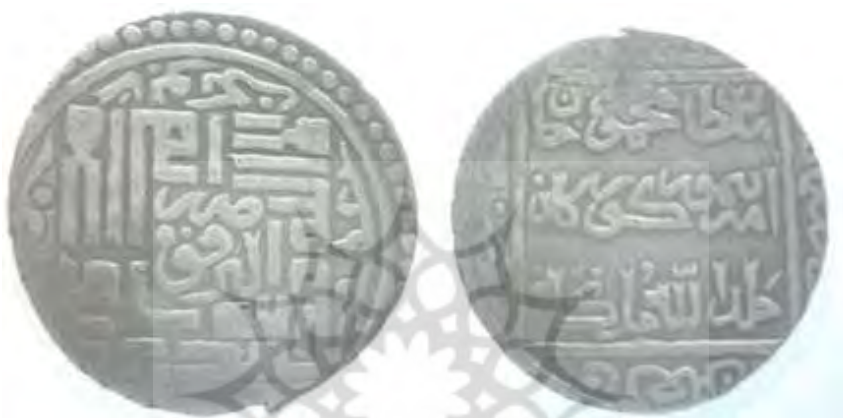
(علاءالدینی، سکه‌های ایران دوره گورکانیان، ۴۷)

بزرگ و تقریباً در مرکز سکه نقره شده و چیش جالبی دارند: «لا اله الا الله/ [به خط ثلث] ضرب ابرقوه/ محمد رسول الله». در حاشیه اسامی خلفای راشدین در مسیر جهت عقربه‌های ساعت حک شده که اسامی «ابوبکر» و «عمر» را می‌توان خواند. نوشته‌ها به خط ثلث در پشت سکه درون یک مربع قرار دارند: «سلطان محمودخان امیر تیمور گورکان خلدالله ملکه». در حاشیه سکه سال ضرب آمده است: «فی شهر/ سنة سبع/ و تسعين/ و سبعمائه» [۷۹۷ق].