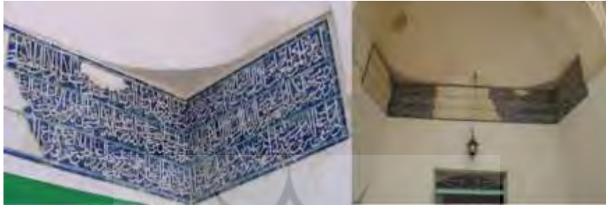
تصویر شماره ۲. کتیبه سردر مسجد بیرون در ابرکوه

مقبره، اکنون قبر طاوس الحرمین در داخل کتابخانه تکیه محله طاوس در منطقه نظامیه ابرکوه قرار دارد. این محله از قدیم الایام محل سکونت دراویش بود و امروز به محله درویش‌ها هم شهرت دارد. مزار طاوس اوقاف فراوانی داشت که در بقایای کتیبه سردر مسجد بیرون ابرکوه ۱ هنوز نام طاوسییه و برخی از اوقاف مشهود است ۲ (تصویر شماره ۲).