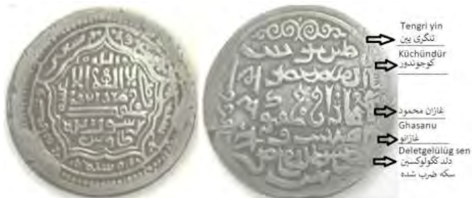
(علاءالدینی، سکه‌های ایران دوره ایلخانان مغول، ۱۲۷)

فلوس ۱ غازانی: از دوره غازان فلوس ضرب طاوس در دست است که ۲/۳۲ گرم وزن و ۲۰ میلی‌متر قطر دارد. بر روی فلوس و درون یک دایره که با نقطه‌چین طراحی شده عبارت «طاوس» دیده می‌شود و این دایره با دو مربع احاطه شده است. به نظر می‌رسد اسامی خلفای راشدین در حاشیه نقر شده باشد. نوشته‌های پشت فلوس هم به خط اویغوری است که با نوشته‌های سکه پیشین یکی است.