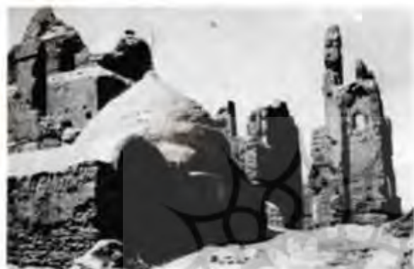
تصویر شماره ۱. مقبره طاوس الحرمین (کنار، آثار ایران، ج ۳، ۴، بخش دوم، ۲۴۰)

سکه‌های ضرب طاوس را معرفی ۱ و فقط در پاورقی اشاره‌ای به دارالضرب کرده است. ۲ با توجه به ضرورت بحث، پژوهش حاضر به دو موضوع مهم که در پژوهش‌های پیشین مورد غفلت واقع شده، پرداخته است: معرفی ابرکوه به‌عنوان جایگاه دارالضرب طاوس و بررسی و تحلیل سکه‌های دارالضرب این شهر که بیش‌تر آن‌ها در مجموعه شخصی ۳ نگه‌داری می‌شوند و تاکنون معرفی نشده‌اند.