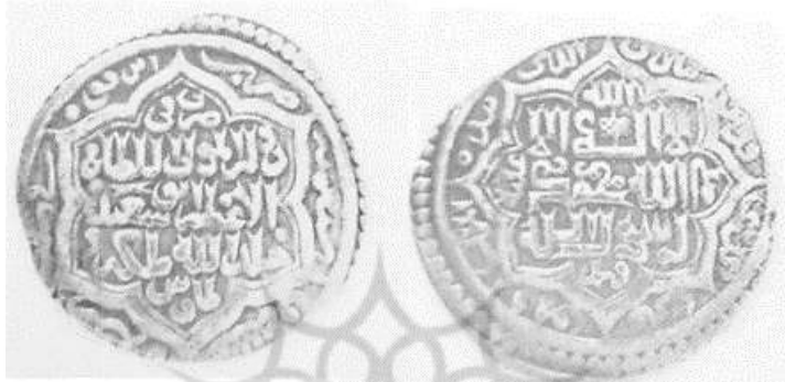
(علاءالدینی، سکه های ایران دوره ایلخانان مغول، ۳۰۱)

برگرفته و در میان آن‌ها عبارت «تبارک الذی بیده الملک و هو علی کل شیء قَدیر» ۱ نوشته شده و یک نشان حکومتی بر روی «اله» دیده می‌شود. در پشت سکه دو طرح شش ضلعی درون یکدیگر قرار دارند و در درون آن چنین نوشته شده است: «ضرب فی الدوله المولی السلطان الاعظم ابوسعید خلدالله ملکه طابوس». در حاشیه سکه چنین نوشته شده است: «ضرب ابرقوه فی سنة سبع عشر و سبعمائه» [۷۱۷ق].