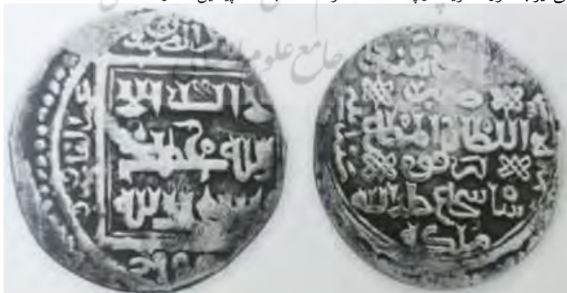
(علاءالدینی، سکه‌های ایران: از انقراض ایلخانان مغول تا استیلای تیمور گورکان، ۱۳۴)

سکه شماره ۳: این سکه ۲/۸۲ گرم وزن و ۲۲/۲ میلی متر قطر دارد. در روی سکه مربعی درون دایره طراحی و نوشته‌ها به خط کوفی تزئینی است: «لا اله الا الله محمد رسول الله». در حاشیه اسامی خلفای راشدین به همراه القاب آن‌ها و عکس جهت حرکت عقربه‌های ساعت نقر شده است: «ابوبکر الصديق/ عمر الفاروق/ عثمان ذی النورین/ (علی المرتضی)». نوشته‌ها درون یک دایره بزرگ در پشت سکه نقر شده است: «امیرالمؤمنین و/ ضرب/ السلطان المطاع/ ابرقوه/ شاه شجاع خلد الله ملکه». در حاشیه نوشته‌ها و از سمت چپ به راست سال ضرب سکه آمده است: «سنة اثنی و سبعین و سبعمائه». [۷۷۲ق]. چهار نشان حکومتی نیز به صورت قرینه در پشت سکه نقر شده که با سکه پیشین متفاوت است.