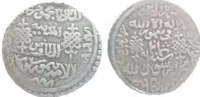
(علاءالدینی، سکه‌های ایران دوره گورکانیان، ۲۴)

سکه شماره ۴: این سکه در سال ۸۰۰ق ضرب شده و ۶/۱۸ گرم وزن و ۲۸/۲ میلی متر قطر دارد. عنوان محل ضرب «ضرب مدینه طاوس» است و از نظر طرح و نوشته با سکه دیگر که «ضرب ابرقوه» دارد، یکسان است. در روی سکه به ترتیب از بالا به پایین چنین نوشته شده است: «لا اله الا الله/ فی شهر ثمانمائه/ محمد رسول الله». در دو سمت نوشته‌ها دو نشان حکومتی نقر شده و اسامی خلفای راشدین برخلاف جهت حرکت عقربه‌های ساعت در حاشیه آمده است: «ابوبکر الصدیق/ عمر الفاروق/ عثمان ذی النورین/ علی المرتضی». در پشت سکه و درون دایره به ترتیب از بالا به پایین چنین نوشته شده است: «السلطان محمودخان المدینه الطاوس امیر تیمور گورکان». در حاشیه سکه چنین نوشته شده است: «فی شهر سنة ثمانمائه». دو نشان حکومتی نیز در دو سمت نوشته‌ها نقر شده است.