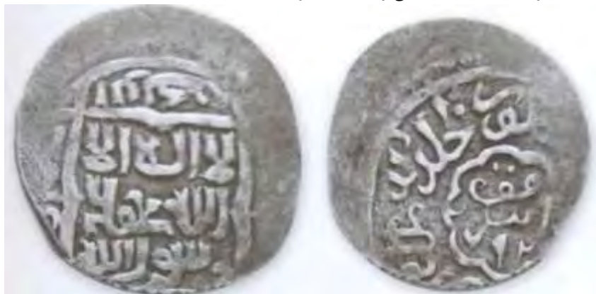
(علاءالدینی، سکه‌های ایران: از انقراض ایلخانان مغول تا استیلای تیمور گورکان، ۱۶۲)

سکه شماره ۵: سکه‌ای از شاه منصور (حک: ۷۹۰-۷۹۵ق)، آخرین پادشاه آل مظفر در دست است که دقت لازم در ضرب ندارد. این سکه ۱/۰۴ گرم وزن و ۱۷/۴ میلی متر قطر دارد. بر روی سکه و درون طرحی مربع شکل، به خط کوفی تزئینی چنین نوشته شده است: «لا اله الا الله محمد رسول الله». دایره‌ای نوشته‌های مرکز سکه را دربرگرفته و در حاشیه اضلاع مربع، اسامی خلفای راشدین عکس جهت حرکت عقربه‌های ساعت نقر شده است: «ابوبکر/عمر/عثمان/علی». در پشت سکه و درون یک طرحی با هشت قوس، محل و سال ضرب سکه آمده است: «ضرب ابرقوه/۷۹۲». به دلیل آسیب دیدگی در حاشیه، فقط عبارت «منصور خلد الله ملکه» را می‌توان مشاهده کرد.