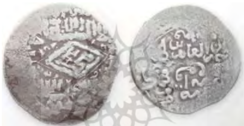
(علاءالدینی، سکه‌های ایران از انقراض ایلخانان مغول تا استیلای تیمور گورکان، ۱۶۰)

سکه شماره ۴: سکه‌ای از دوره زین العابدین مظفری (حک: ۷۸۶-۷۸۹ق) موجود است که ۱/۶۹ گرم وزن و ۲۰/۸ میلی متر قطر دارد. آسیب دیدگی طرح احتمالی روی سکه را از بین برده است. با وجود این، در مرکز نوشته‌ها از سمت راست به چپ چنین نوشته شده است: «زین العابدین خلد الله ملکه»، سپس از پایین به بالا مکان ضرب سکه آمده است: «ضرب ابرقوه». سال ضرب سکه در جهت حرکت عقربه‌های ساعت نقر شده است: «ثمان و ثمانین و سبعمائه». [۷۸۸ق]. در پشت سکه از بالا به پایین و به خط کوفی چنین نوشته شده است: «الله لا اله الا الله محمد [درون یک طرح لوزی] رسول الله». در حاشیه اسامی خلفای راشدین نقر شده است: «ابوبکر/عمر/عثمان/علی».