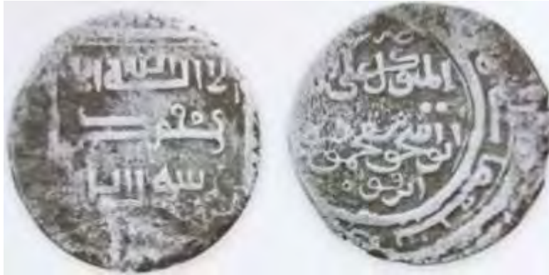
(علاءالدینی، سکه‌های ایران از انقراض ایلخانان مغول تا استیلای تیمور گورکان، ۲۱)