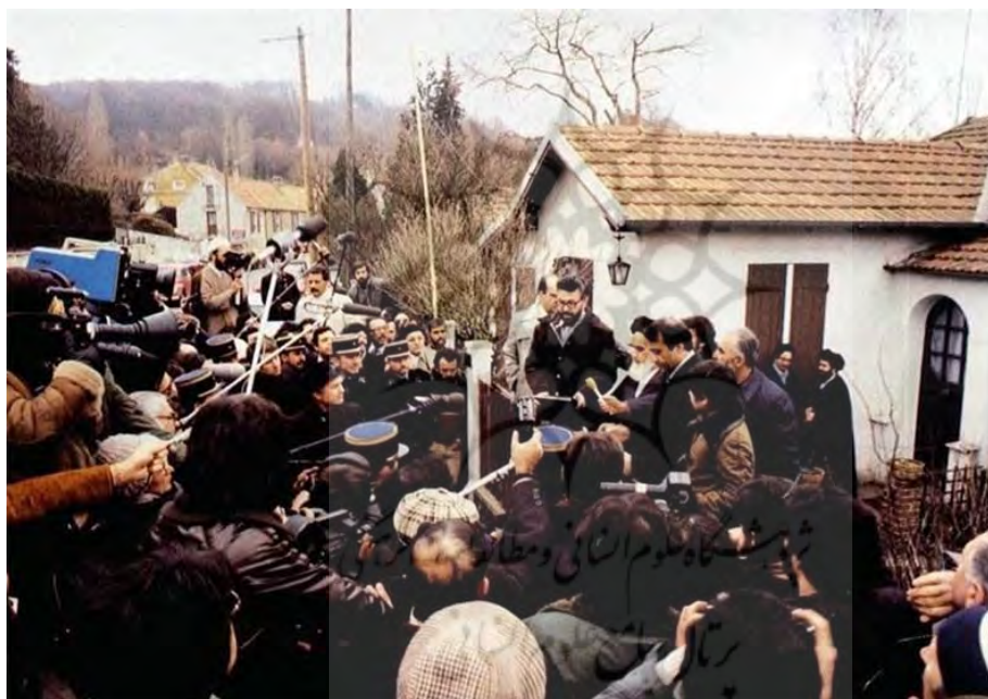
تصویر: مصاحبه حضرت امام خمینی رحمه الله علیه با خبرنگاران، فرانسه-نوفل لوشاتو.

امام فُذَسْ سَرُّهٗ در عین حالی که مسلمان شیعه متعصب و اصول‌گرا بود و هرگز حاضر نشد ذره‌ای از اصول مسلم مذهب شیعه‌ی اثنی‌عشری عدول کند (امام خمینی، ۱۳۷۶: ۲۱۰). تا جایی که غرب و به‌ویژه ایالات متحده‌ی آمریکا را مسحور خود می‌کند، گراهام فولر ۱ ، از تئوریسین‌های برجسته‌ی علوم سیاسی، امام خمینی فُذَسْ سَرُّهٗ را نماد تمامی نگرانی‌های عمیق غرب نسبت به اسلام رادیکال دانسته و معتقد است که داوری آمریکایی‌ها درباره‌ی ماهیت رفتار ایران، دست کم در عرصه‌ی عمومی، عمیقاً تحت تأثیر چهره و شخصیت مهم و غیر متعارف امام خمینی فُذَسْ سَرُّهٗ، به‌عنوان خطرناک‌ترین رهبر خارجی است، که آمریکا را با اصطلاحی قرون وسطایی توصیف کرده و در جاتی از شیطانیت را به آن نسبت داده‌است (فولر، ۱۳۷۳: ۶).