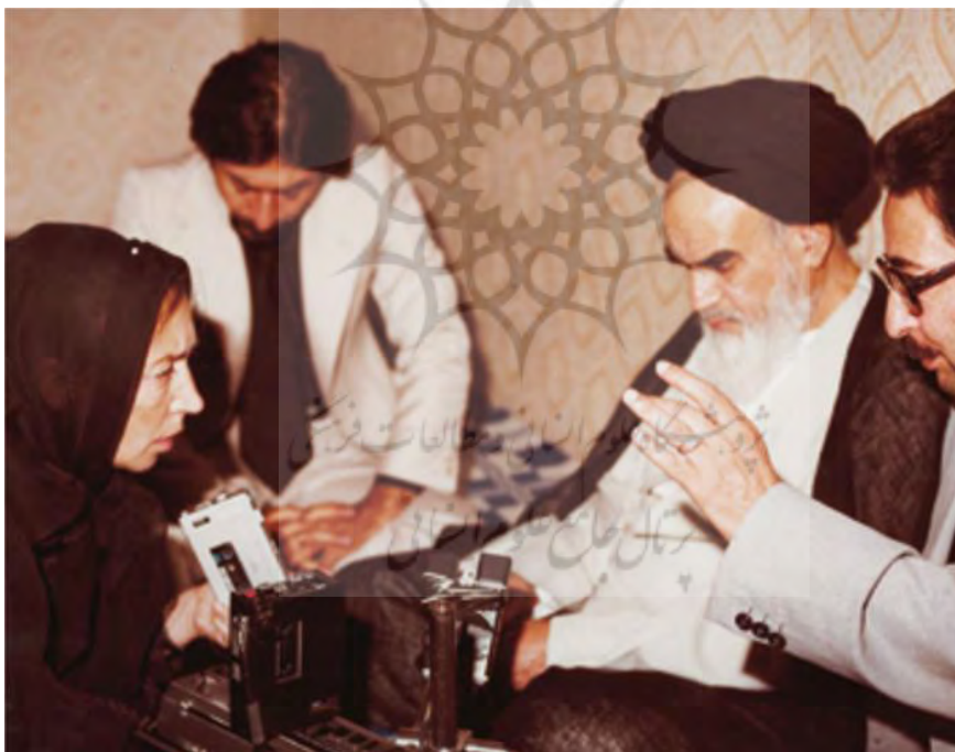
تصویر: مصاحبه اورینا فالاجی با حضرت امام خمینی رحمه الله علیه.

«من نظری به دیگران ندارم راجع به خودم می‌گویم از این وضع موجود رادیو-تلویزیون خوشم نمی‌آید. واقع آن است که آن قدر که پابرنه‌ها به رادیو-تلویزیون حق دارند، ما نداریم. این یک واقعیت است و تعارف نیست؛ واقع این است که آن‌ها این نظام را درست کرده‌اند و این نهضت را به وجود آوردند؛ همین جمعیت هستند که پیروزی‌ها را به دست آوردند؛ از قشر بالا کسی در این مسأله حقی ندارد. البته ما هم در اصل مطلب شرکت داشته‌ایم، اما حق با آن‌هاست. من مدت‌هاست که وقتی می‌بینم رادیو-تلویزیون را هر وقتی باز می‌کنم از من اسم می‌برد، خوشم نمی‌آید. ما باید به مردم ارزش بدهیم، استقلال دهیم و خودمان کنار باشیم و روی خیر و شر کارها نظارت کنیم [آقای محمد هاشمی، مدیر عامل رادیو-تلویزیون اظهار داشت: شما در قلب مردم جا دارید. و امام قُدس سرّه فرمودند: قلب مردم در غیر از این‌هاست. مسئله این‌ها نیست، ما سابقاً با مردم تماس داشتیم و به آن‌ها ارادت داشتیم و مردم به ما لطف داشتند، ولی این‌طور نبود که ما رادیو-تلویزیون داشته باشیم، آن باب دیگری است. در هر صورت بعضی مواردی که لازم است مانعی ندارد، در غیر آن موارد، من میل ندارم، دیگران خودشان می‌دانند» (صحیفه نور جلد ۱۹ صفحه ۳۴۶ و ۳۴۷).