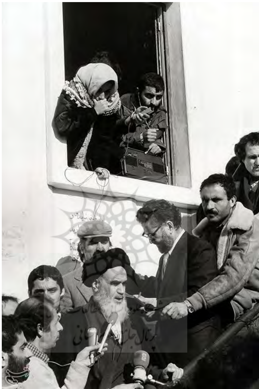
تصویر: مصاحبه حضرت امام خمینی رحمه الله علیه با خبرنگاران و روزنامه‌نگاران.