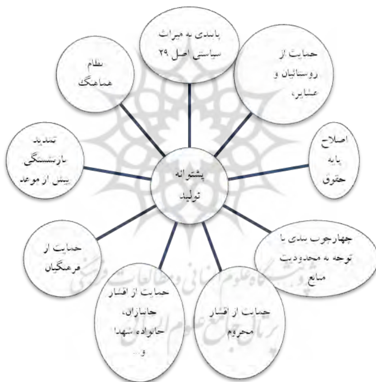
شکل ۳- مفصل‌بندی بازنشستگی بر مبنای گفتمان سازندگی

با توجه به تحلیل متون، می‌توان ادعا کرد که مفهوم بازنشستگی در بستر گفتمان زمینه سازندگی / توسعه اقتصادی را باید حول تولید معنایی کرد. یعنی یا به‌طور مستقیم در راستای به‌گردش درآوردن چرخه تولید است و یا این حمایتی است و به‌طور مستقیم در پی کاهش انتقادات سیاسی و اجتماعی، آرام‌سازی و تلطیف فضای سیاسی و اجتماعی کشور، با هدف راه‌اندازی تولید بوده است. می‌توان مفصل‌بندی بازنشستگی را در بستر گفتمان زمینه‌ای دوره سازندگی به شرح زیر نشان داد.