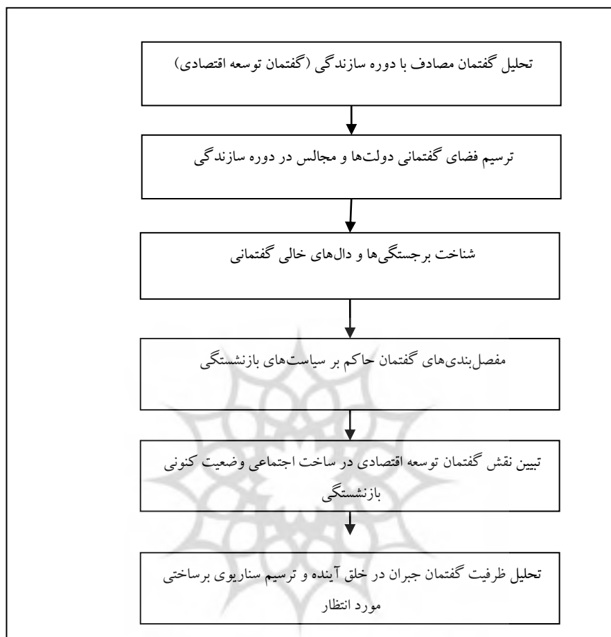
شکل ۲- مدل مفهومی تحقیق (تبیینی)

بر اساس مدل بالا، ابتدا تلاش می‌شود تا گفت‌وگوهای مصادف با دوره سازندگی ترسیم شود. یعنی بر اساس متون سخنرانی‌ها و سایر منابع فضای کلان گفت‌وگویی حاکم بر کشور از جمله حاکم بر خط‌مشی‌گذاری‌های تأمین اجتماعی و بازنشستگی ترسیم می‌گردد. در مرحله بعدی متون مربوط به بازنشستگی در بستر گفت‌وگوهای حاکم بر برهه مورد مطالعه تحلیل می‌شود. تلاش می‌شود تا شرایط امکانی که گفت‌وگوهای توسعه اقتصادی برای کنش‌های خاص سیاستی فراهم کرده است، نشان داده شود. همچنین قدرت این گفت‌وگوها در ایجاد وابستگی به مسیر تبیین می‌شود، وقتی که نقش این گفت‌وگوها در وضعیت کنونی