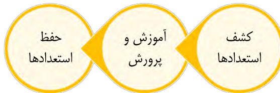
شکل ۴. الگوی حمایت از نخبگان فرهنگی شهر

به‌نظر می‌رسد، طراحی مسابقات، ایده‌خوبی برای کشف استعدادها باشد و در مرحله بعد باید برای استعدادهای شناخته‌شده برنامه‌ریزی کرد و فرایند آموزش و پرورش (در ادامه توضیح داده خواهد شد) را ادامه داد. به‌نظر می‌رسد، اجرای مرحله بعد که مرحله حفظ استعدادها است، نیاز به همکاری تمام مسئولان شهری و سازمان‌های مربوطه دارد.