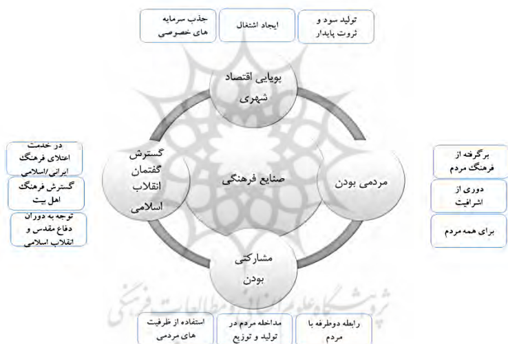
شکل ۲. شبکه مضامین صنایع بومی

با گسترش فناوری و وسایل ارتباطی، مردم عادی نیز از توانایی تولید فرهنگ برخوردار شده‌اند و این امر سبب شده است که تولید فرهنگ به امری همه‌جایی تبدیل شود و تنها در اختیار دولت‌ها و گروه‌های خاصی نباشد. افزون‌براین، برای جذب مخاطب لازم است که او را در مراحل مختلف صنایع فرهنگی دخیل کنیم تا بتوان بدنه مردمی را به این صنایع جذب کرد. این مشارکت می‌تواند در قالب ایده‌پردازی‌ها در مراحل تولید و ساخت محصولات فرهنگی قرار گیرد. همچنین، مردم می‌توانند بسترهای توزیعی مناسبی را در صنایع فرهنگی فراهم کنند.