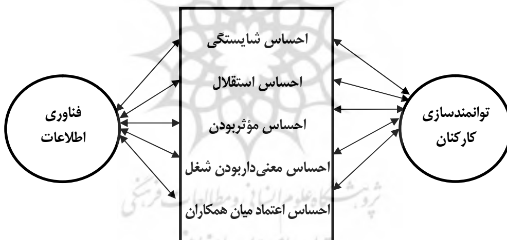
شکل شماره 1. مدل مفهومی پژوهش

مدل مفهومی پژوهش در این مقاله با توجه به چهارچوب نظری و توضیحات ارائه شده در ادبیات تحقیق، شامل متغیر مستقل توانمندسازی منابع انسانی است که خود شامل پنج مؤلفه می شود: احساس شایستگی، احساس استقلال، احساس مؤثر بودن، احساس معناداری شغل و احساس اعتماد میان همکاران. متغیر وابسته نیز، فناوری اطلاعات است. در این تحقیق تلاش بر آن است که ارتباط میان متغیر توانمندسازی منابع انسانی با فناوری اطلاعات در سازمان تأمین اجتماعی بررسی شود.