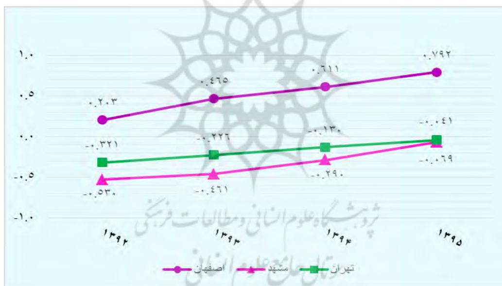
نمودار ۴- روند معیار زیست‌پذیری فرهنگی در سه کلان‌شهر مطالعه‌شده

مشهد آخرین کلان‌شهر از لحاظ بهره‌مندی شاخص زیست‌پذیری فرهنگی است و در طی دوره پژوهش مقادیر منفی داشته است. مشهد در این شاخص از ۰/۵۳۰- در ابتدای دوره به ۰/۰۶۹- در انتهای دوره رسیده است و با اینکه در مقایسه با تهران رتبه پایین‌تری دارد، رشد بهتری داشته و در انتهای دوره تقریباً دو کلان‌شهر مشهد و تهران، مقادیر نزدیک به هم و نزدیک به صفر داشته‌اند.