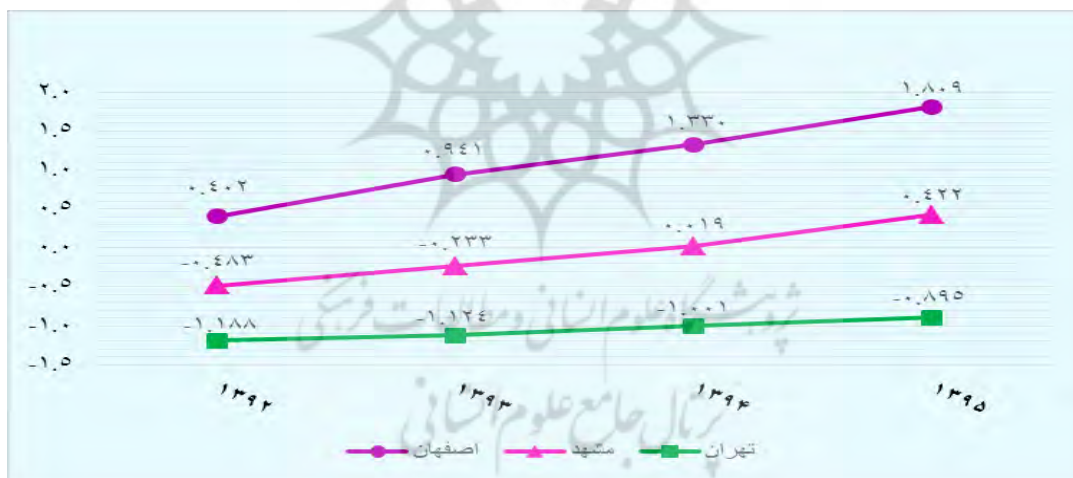
نمودار ۳- روند شاخص حمایت از فرهنگ در سه کلان‌شهر مطالعه‌شده

در مقایسه زیرشاخص حمایت از فرهنگ با استفاده از مقادیر سرانه استاندارد به ازای هر ۱۰۰۰۰ نفر جمعیت در