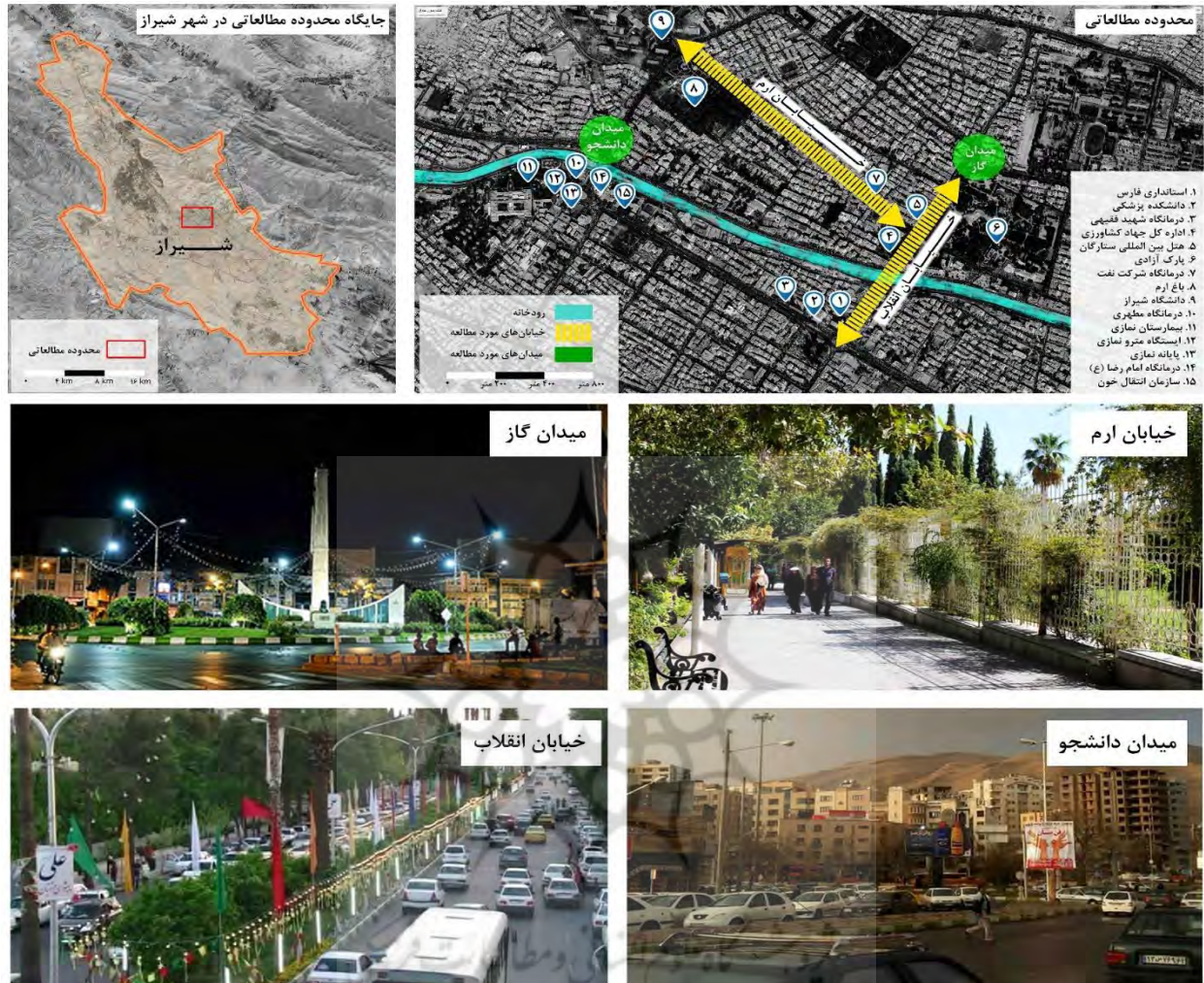
شکل ۲- موقعیت مکانی فضاهای عمومی شهری منتخب در شهر شیراز

مستقیم دارند و در کمتر فضای عمومی دیگری در شهر شیراز (مانند فضاهای موجود در بافت تاریخی مانند محدوده ارگ و