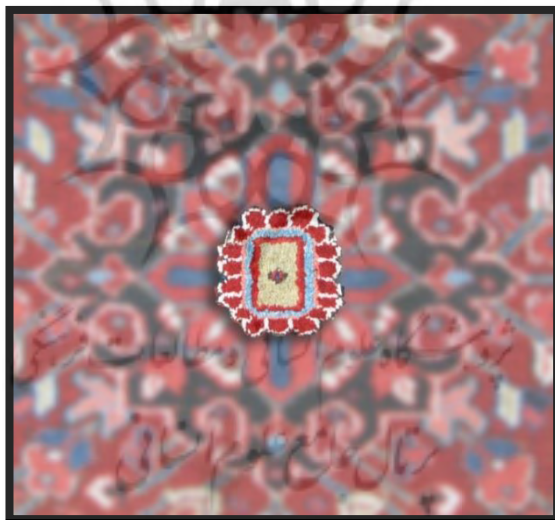
تصویر ۷. گوبک (ناف) مستطیل

۱. گوبک ۲ (ناف): نقشی است که در وسط قالی بافته می‌شود و در بعضی از روستاها به آن آینه و نیمچه نیز می‌گویند. گوبک اغلب به صورت اشکال مربع، مستطیل، شش گوش و هشت گوش و گاه به صورت اشکال پیچیده‌تر و ترکیبی بافته می‌شود.