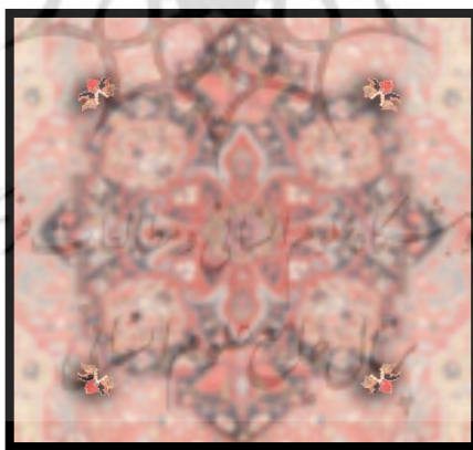
تصویر ۹. دستک، گل‌های چهار طرف ترنج

۳. دستک ۲ : گلی است که به چهار طرف ترنج و در راستای مورب آن با زاویه ۴۵ درجه قرار دارد. برخی نیز آن را دسته‌گل می‌گویند.