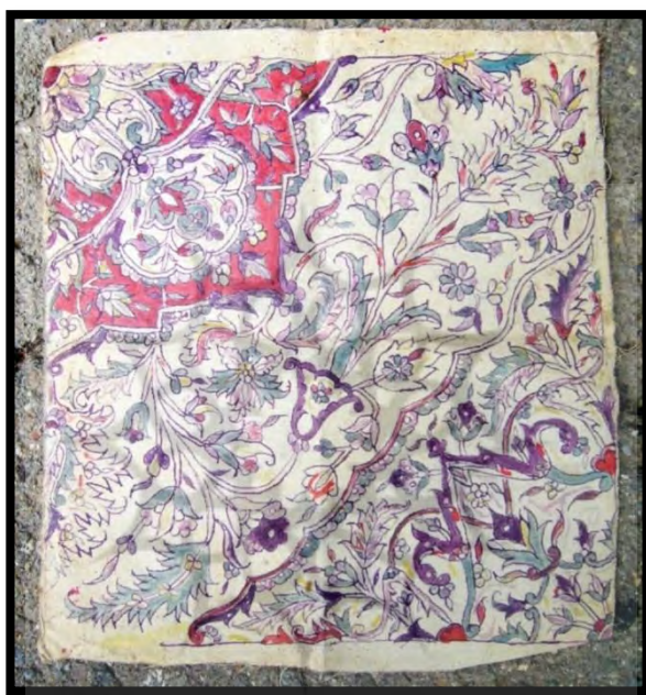
تصویر ۶. چشنی (دستمال نقشه) نمونه‌ای از طرح تاجری

الگوبرداری و طرح جدیدی برای بافت قالی با خصوصیات قالی هریس ارائه می‌کردند؛ هر چند پس از بافت، بازشناسی این دو از همدیگر کار آسانی نبود. استفاده از دستمال نقشه‌ها تأثیرات فراوانی در کیفیت و پویایی طرح قالی‌های هریس و حفظ جایگاه هنری و حتی تجاری آنها داشته؛ به گونه‌ای که رواج نقشه‌های جدید کاغذی و