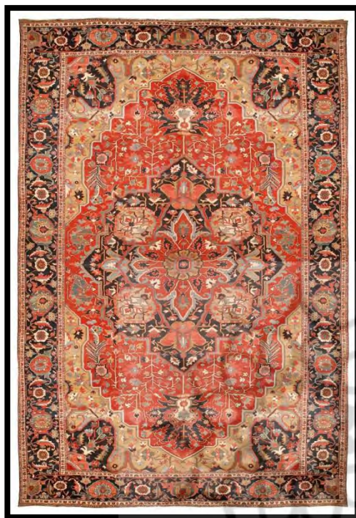
تصویر ۱۵. قالی لچک و ترنج سرمه‌ای هریس

در قدیم پس از رنگرزی الیاف، آنها را در آب روان قرار می‌دادند تا به ثبات رنگی