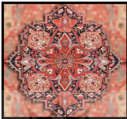
تصویر ۸. گول یا ترنج مرکزی

۲. گول ۱ : گول به معنی برکه و استخر طبیعی است و در قالی به نقش میانی گفته می‌شود. ترنج‌های منطقه دارای چندین نقش تو در تو هستند و نام‌گذاری‌هایی بر اساس رنگ دارند.