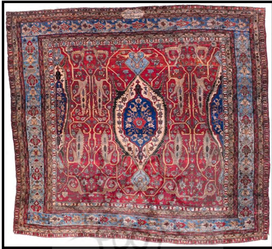
تصویر ۳. قالی تمام ابریشم هریس، کتیبه دار، تاریخ بافت قالی سال ۱۲۴۸ ه.ق (موزه فرش ایران)

قالی های تمام ابریشم هریس، جزو قالی های آنتیک جهان به شمار می روند و امروزه در موزه ها و برخی مجموعه های شخصی می توان نشانی از آنها یافت. در طرح و نقش قالی های تمام ابریشمی هریس، اسلیمی بندی، گل شاه عباسی، قاب قبابی، گلدانی شاه عباسی، محرابی قندیل دار، لچک و ترنج، سرتاسری و گاه دارای خط نوشته مشاهده شده است. در این قالی ها، کتراست هم از حیث تیره و روشن و هم از حیث ضرباهنگ متنوع رنگی، در نقش های ریز و درشت به لحاظ تزئینات دارای جایگاه مهمی است.