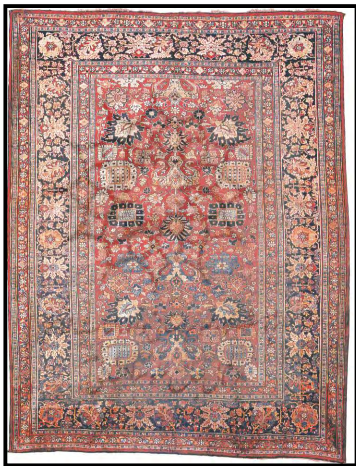
تصویر ۲. قالی تمام‌ابریشم هریس، نیمه دوم سده ۱۳ ه.ق (موزه فرش ایران)

با اینکه قالی بافی در هریس از گذشته‌های دور مرسوم بوده است، اما نام قالی‌های هریس و شهرتش به دوره قاجار برمی‌گردد و زمان شروع صادرات آنها به کشورهای خارجی نیز همین دوره است. در دوره قاجار نیز می‌توان نمونه‌های تمام‌ابریشم از قالی هریس را دید، اما بعد از آن تولیدات تمام‌پشمی با تغییراتی در طرح و رنگ‌بندی آن به وجود آمد.