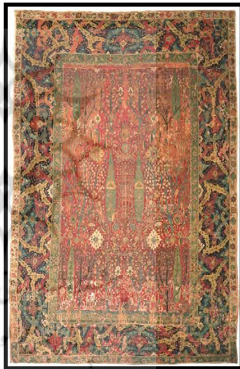
تصویر ۱. قالی طرح درختی احتمالاً بخشایش، قرن دهم هجری (موزه فیلادلفیا)

بیشتر اهالی هریس به کشاورزی و دامداری مشغول‌اند و قالی‌بافی نیز به عنوان حرفه‌ای قدیمی که در هیچ برهه‌ای از تاریخ متوقف نشده است، به شیوه سنتی از سوی زنان انجام می‌شود. در هریس، کار قالی‌بافی در بخش‌هایی همچون بخشایش، قراجه، گوراوان، نمرور، زرنق، ترکایش، اسنق، کلوانق و بیلوردی رواج دارد. با اینکه بسیاری از شواهد و آثار بر جای مانده در منطقه، وجود قالی‌بافی در هریس را از سال‌ها پیش تأیید می‌کند، اما هیچ منبع مستندی پیش از دوره صفوی در این زمینه وجود ندارد. از دوره صفوی نمونه‌هایی هر چند محدود، اما بی‌نظیر از قالی منطقه موجود است. پوپ ۱ دو نمونه قالی در کتاب خود ارائه و آنها را به بخشایش (شهری کوچک در نزدیکی هریس) نسبت می‌دهد و می‌نویسد: در بخشایش که در جنوب اردبیل قرار دارد، کارگاه مهمی وجود داشته که تولیدکننده قالی‌های خوبی در شمال غربی ایران است (پوپ و اکرم، ۱۳۸۷: ۲۲۳۰).