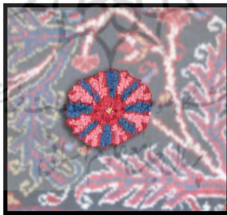
تصویر ۱۱. شمامه یا شاماما

۵. شمامه یا شاماما ۲ : میوه بومی آذربایجان که شباهت بسیاری با طالبی دارد و کمی از آن کوچک‌تر است. شمامه‌های بزرگ و کوچک به صورت گل‌های پنج‌پر، شش‌پر، هفت‌پر، هشت‌پر و گاهی بیشتر در قالی‌های منطقه وجود دارند.