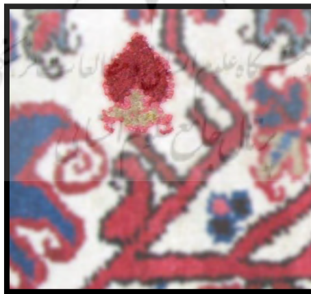
تصویر ۱۳. بادام گلی

۷. بادام گلی: گلی که از دو قسمت کاسبرگ و غنچه تشکیل شده است. این نقش به ساقه‌های گیاهان در ضمیمه، ترنج و لچک متصل می‌شود و برای تزئین ساقه‌ها مورد استفاده قرار می‌گیرد. از آنجا که شبیه بوته است، به آن بادام گل می‌گویند.