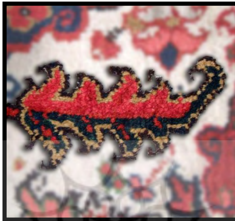
تصویر ۱۲. بالیق (ماهی) برگ خمیده

۶. بالیق: به معنی ماهی است و از قدیم در قالی‌های منطقه به برخی از انواع برگ‌ها گفته می‌شود. ماهی نماد خوشبختی، برکت و روزی است. بالیق با انواع مختلف (خمیده و عمودی) در ترنج و حاشیه‌ها به کار می‌رود.