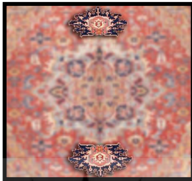
تصویر ۱۰. نجاق (هیکل و یا علم‌باشی)

۴. نجاق ۱ : در هریس به سر ترنج، نجاق می‌گویند که بر حسب نقشه، انواع مختلفی دارد. در برخی روستاهای اطراف به آن هیکل یا علم‌باشی نیز می‌گویند.