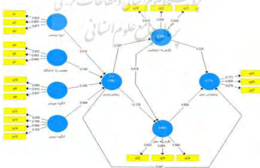
شکل ۲. میزان ضریب اثر مدل پژوهش

در بخش آمار استنباطی برای بررسی مجدد ارتباط میان مؤلفه‌ها با متغیرهای مربوط از تحلیل عاملی تأییدی برای کلیه متغیرها استفاده شد. شکل (۲)، نتایج بارهای عاملی گویه‌های مربوط به هر متغیر را نشان می‌دهد.