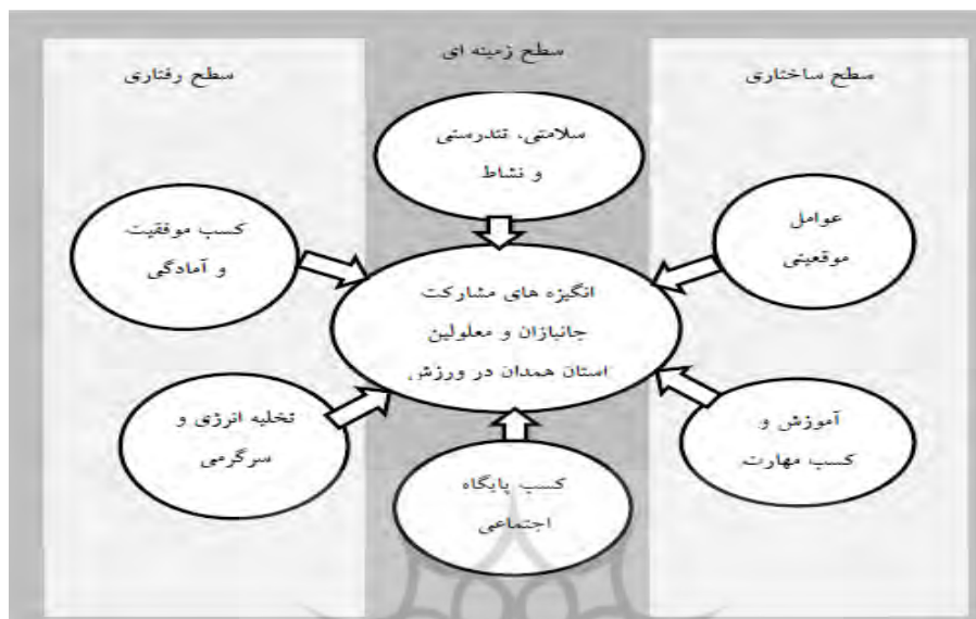
شکل ۲- مدل انگیزه‌های مشارکت جانبازان و معلولین استان همدان در ورزش (مدل فاز اول- کیفی)