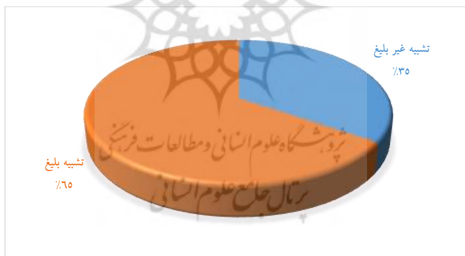
نمودار ۲- نسبت تشبیه بلیغ به غیر بلیغ