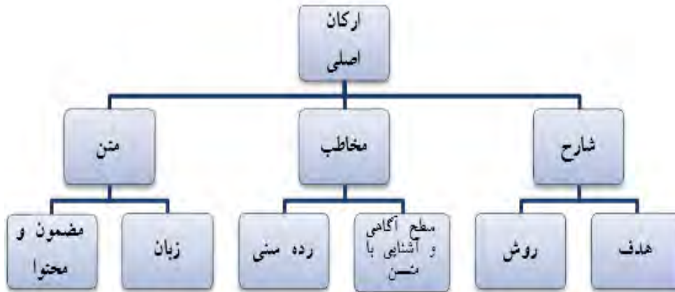
نمودار شماره ۱: ارکان اصلی و فرعی شرح مثنوی

با توجه به نکات و نمودار بالا می‌توان جایگاه روش را در فرایند شرح تبیین کرد: شارح پس از خواندن صحیح متن و فهم محتوای آن برای حفظ و انتقال معنای متن، شیوه و روشی برای تبیین مفاهیم برمی‌گزیند. این شیوه متناسب با نیاز مخاطبان و خصوصیات متن به کار گرفته می‌شود. شارح می‌کوشد در آوردن توضیحات به نکاتی مانند ترتیب ارائه مطالب، اولویت‌بندی بیان مطالب و نحوه تبیین لایه‌های مختلف متن توجه کند. با بررسی روش شرح، می‌توان جریان فکر شارح و شیوه گذر او از لایه‌های روین متن و نفوذ به معنای آن را دریافت.