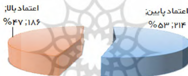
شکل ۲- دسته‌بندی افراد براساس تجربه

۱۸۶ نفر یعنی ۴۷٪ افراد در زمره افراد با اعتماد بالا قرار دارند و ۲۱۴ نفر یعنی ۵۳٪ افراد نیز اعتماد کمتری دارند. مدل ساختاری به تفکیک هر گروه اجرا شده است. نتایج زیر به تفکیک هر گروه به دست آمده است: