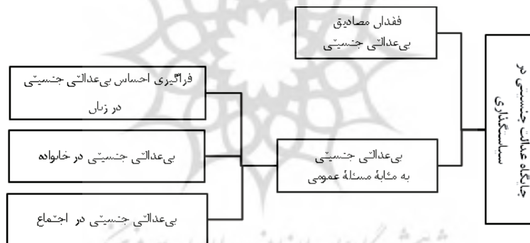
شکل ۱. مقوله «جایگاه عدالت جنسیتی در سیاستگذاری» و زیرمقولات

مثلاً موردی که عدالت جنسیتی رعایت نشده، فضای شهر را که ببینید، فضای مردانه‌تری است. ملاحظاتی جنسیتی را نمی‌بینید. چون مدیران و سیاستگذاران بیشتر مردان هستند، اصولاً این حساسیت در ذهنشان شکل نگرفته (۸).