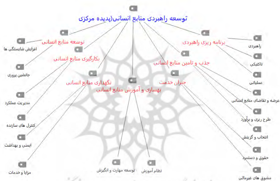
شکل ۱. نظرات خبرگان در مورد توسعه راهبردی مدیریت منابع انسانی