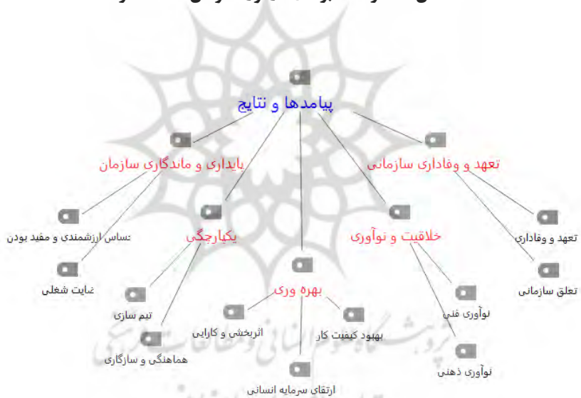
شکل ۵. نظرات خبرگان درمورد پیامدها و نتایج