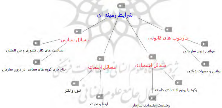
شکل ۳. نظرات خبرگان درمورد شرایط زمینه‌ای