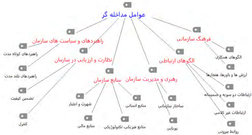
شکل ۴. نظرات خبرگان درمورد عوامل مداخله‌گر