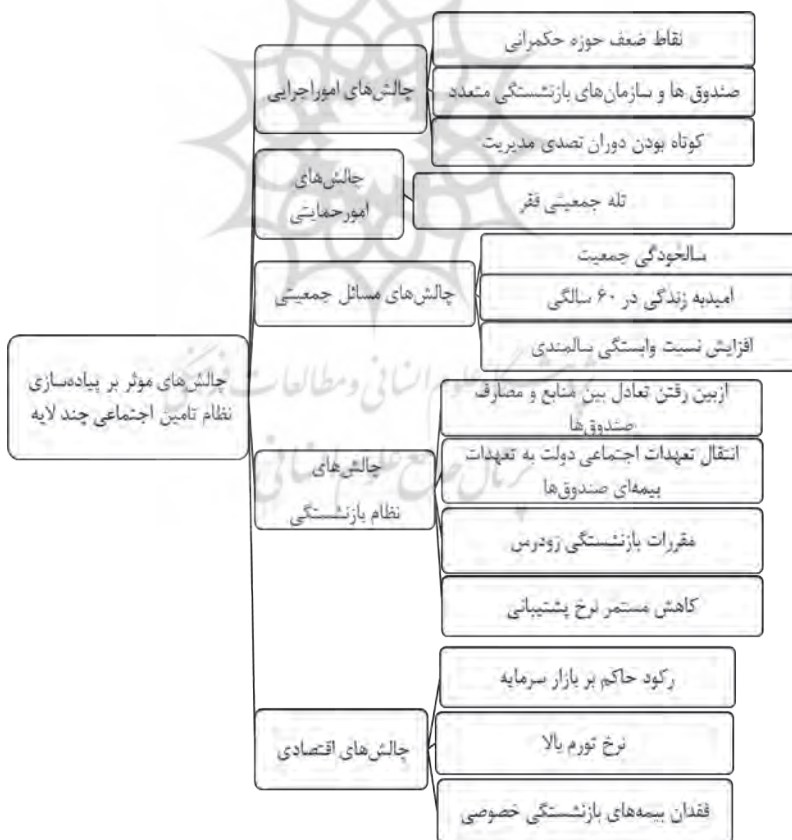
شکل شماره ۱. مدل مفهومی عوامل مؤثر بر پیاده‌سازی نظام چندلایه تأمین اجتماعی

با استفاده از پیشینه پژوهش و مصاحبه با خبرگان موانع پیاده‌سازی نظام تأمین اجتماعی چندلایه مشخص شد. بدین ترتیب پنج مؤلفه اصلی و پانزده زیرمؤلفه شناسایی شد که مدل مفهومی پژوهش حاضر (شکل ۱) بر اساس آن طراحی گردید.