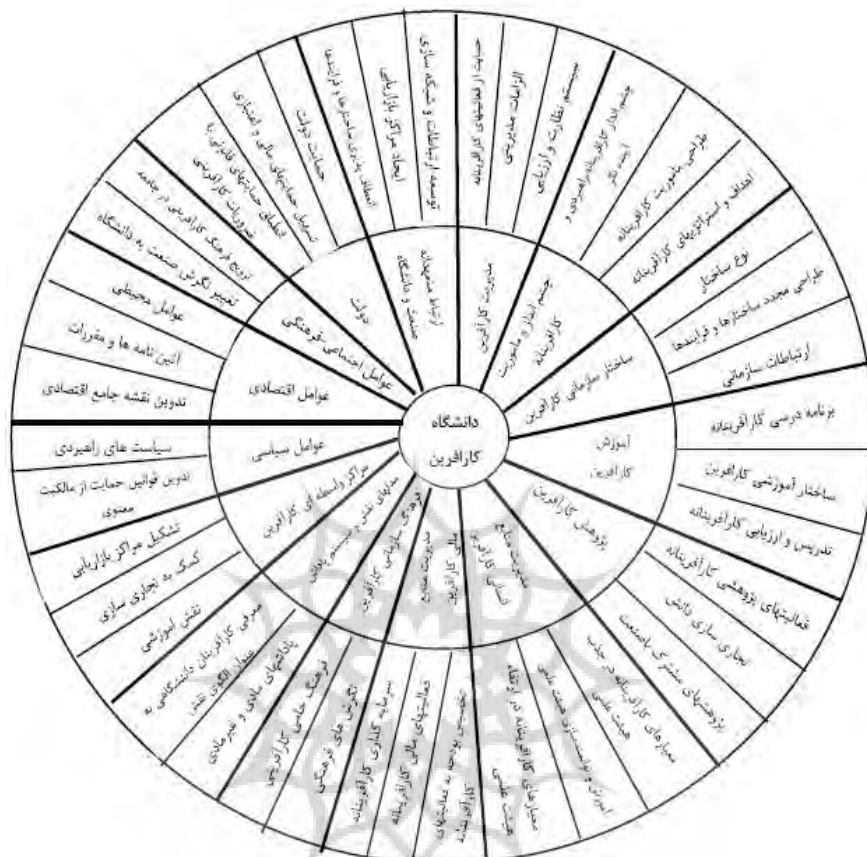
شکل 1: مدل جامع دانشگاه کارآفرین (منبع: یافته‌های محقق)