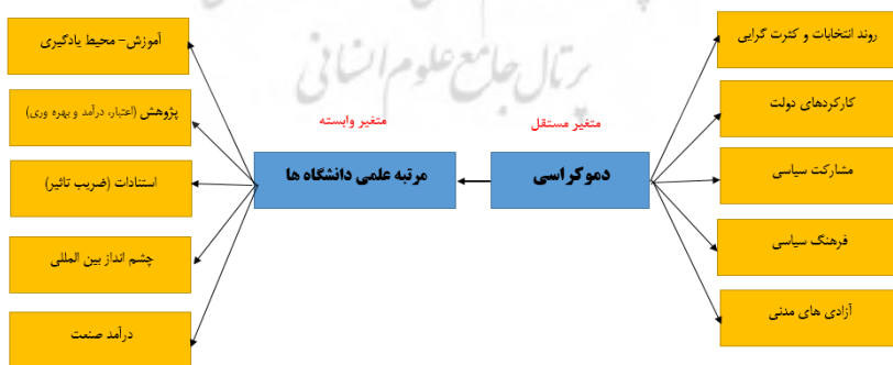
شکل ۱- مدل مفهومی تحقیق

مدل مفهومی مدلی است که محقق روابط میان متغیرها را بر اساس چارچوب نظری پژوهش حدس زده و پیش‌فرض تحلیلی خود قرار می‌دهد. به عبارت دیگر در هر پژوهش هدف محقق بسته به نوع پژوهش شناسایی مدل مفهومی یا آزمون مدل مفهومی است که بر اساس مرور ادبیات پژوهش به دست آمده است. بر اساس مبانی نظری مطرح‌شده در قسمت قبل، مدل مفهومی و فرضیات و سؤالات پژوهش به صورت زیر شکل گرفته است.