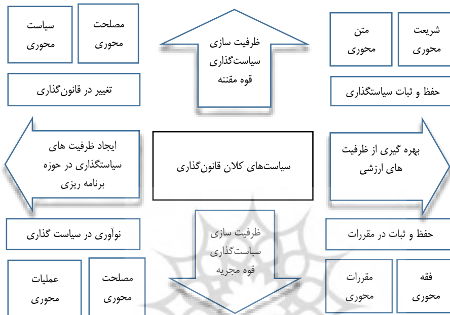
شکل ۲ دسته‌بندی سیاست‌های کلان قانون‌گذاری

مقاله در بخش دوم با تحلیل و تکمیل سیاست‌های قانون‌گذاری ابلاغی مقام معظم رهبری در سال ۱۳۹۸ به بیان دسته‌بندی سیاست‌ها می‌پردازد (جدول ۳). بر اساس این جدول و توضیحات آن ۱۲ دسته برای سیاست‌های کلی قانون‌گذاری ابلاغی استخراج گردید و با بیان برخی از لوازم آن، رویش قانون‌گرایی را نوید بازگشت به رویکرد اسلامی - انقلابی دانست که سبب تقویت ارکان نظام جمهوری اسلامی در حوزه قانون‌گذاری است و بدین‌سان همه سؤالات پژوهش پاسخ داده شد.